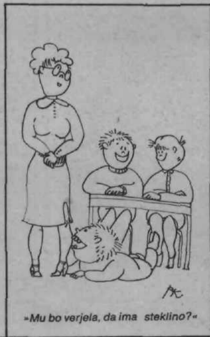
»Mu bo verjela, da ima steklino?«