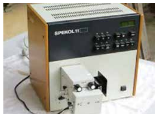
Slika 2: Spektrometer Spekol

Ko je bil »najin« del razvit in v maksimalni možni meri preizkušen, je sledilo potovanje v Beograd. In v avtu sva imela naš računalnik. Po nekajurni vožnji je sledilo prvo srečanje z elektromehanskim delom robota. In skoraj neverjeten čudež. Praktično takoj sta se »naš« in Pupinov del v celoti razumela, čemur je