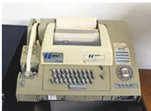
Slika 1: Razvoj programske opreme je potekal s pomočjo teleprinterja

medijev (diskov ali vsaj kaset). In urejevalniki besedila, torej izvorne programske kode, so bili tedaj zelo primitivni, enovrstični, kar je za današnje čase nepojmljivo. Samo za zgled, kako je potekal postopek od odkritja programerske napake do njenega popravka. Naslednjih nekaj stavkov lahko razume le računalnikar tiste generacije. Koraki so bili naslednji: