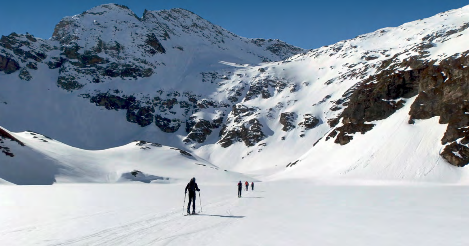
Prečenje zamrznjenega jezerca pri vzponu na Wildenkogel

izhodišče. Takšna je tura na škrbino Wilde Mander, 2600 m, pa tudi turi na Taxkogel, 2629 m, in Graue Schimme, 3053 m. Te ture so samotnejše in redkeje obiskane, že izhodišče z glavne ceste je med avtomobilsko vožnjo težko opaziti. Veljajo kot ture za lokalne poznavalce, a kdo pravi, da ne bomo postali to tudi mi! Ena od njih, Wilde Mander, je podrobneje predstavljena v prilogi.