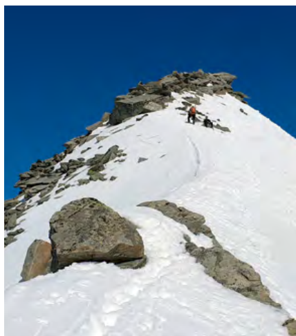
Na vršno kupolo Wildenkogla se povzpemo brez smučí.

Jezero nato prečimo po dolgem, od desne proti levi. Na koncu jezera sprva le slutimo grapo, ki se kmalu izkaže za udoben prehod navzgor. Grapa vodi zdaj proti desni in se više odpre v