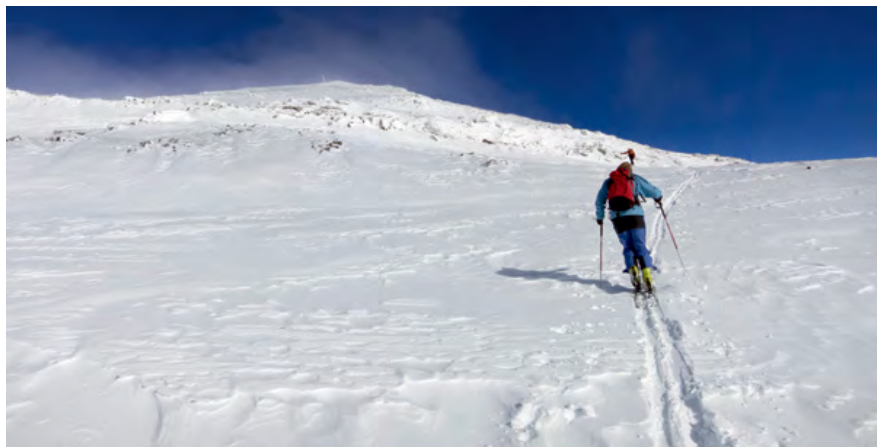
Proti vrhu se Hochgasser postavi pokonci.

Vzpon: Začnemo neposredno pri gostišču, in sicer za kapelo desno gor ob ogradi za živino in v breg. Tam najdemo oskrbno cesto, ki vodi do predora. Tega dosežemo z leve v približno dvajsetih minutah. Nadaljujemo po širokem odprtem pobočju precej prosto, vendar vseskozi rahlo proti levi navzgor. Najprej pridemo do jezera