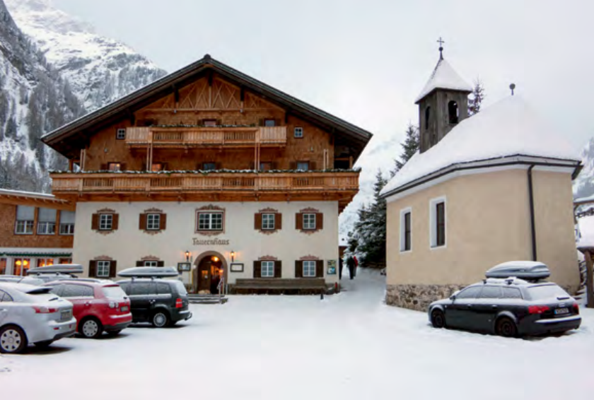
Matreier Tauernhaus v jutranjem snežnem poprhu