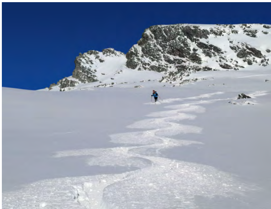
Nagrada za vzpon na Wilde Mander