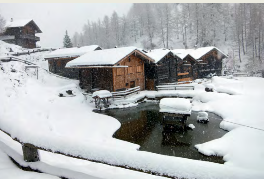
Na planini Innerschlöss