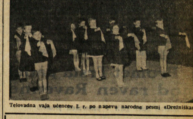
Telovadna vaja učencev I. r. po napevu narodne pesni «Drežniška»