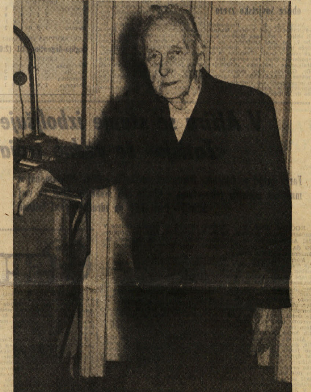
Ena izmed novjših fotografij F. S. Finžgarja