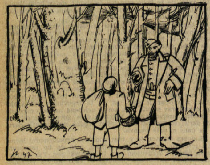
Ko je prišel Pavlek s košarico za gobe do velike bukve, je stopil izza nje mož, ves kosmat in s puško. Nasmehnil se je in takrat ga je Pavlek spoznal — bil je France.