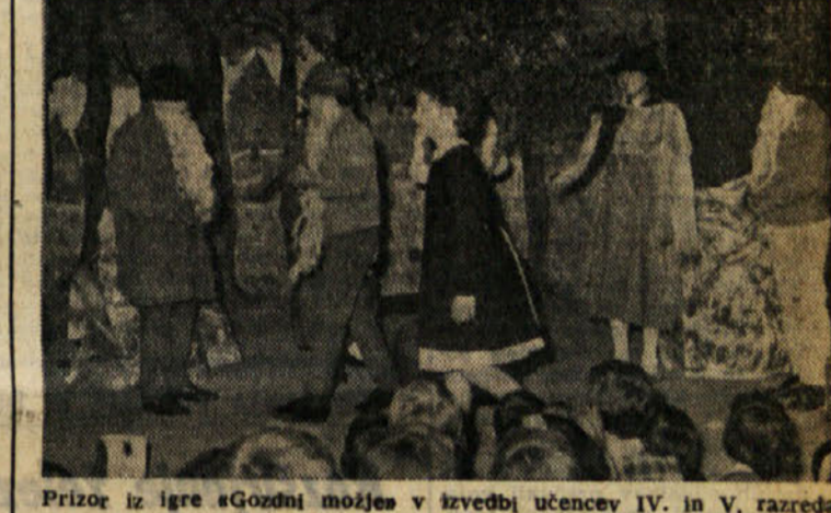
Prizor iz igre «Godni možje» v izvedbi učencev IV. in V. razreda