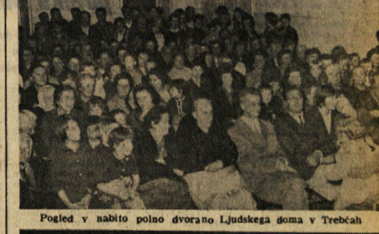
Pogled v nabito polno dvorano Ljudskega doma v Trebach