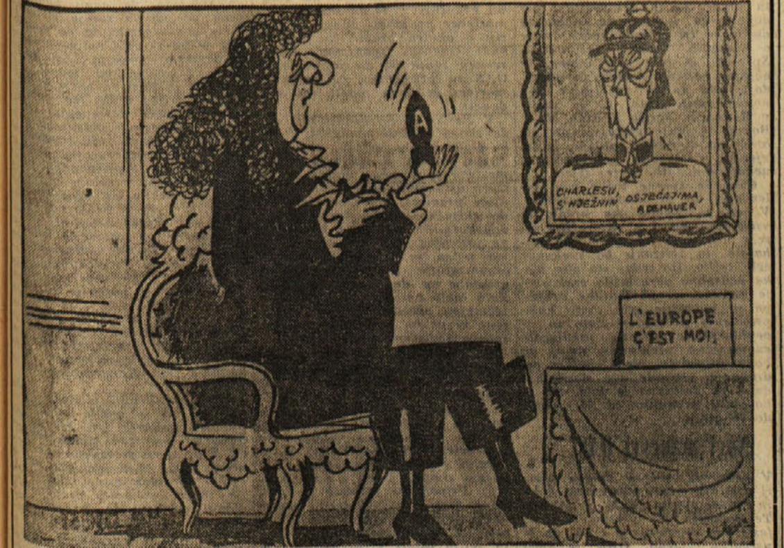
De Gaulle: «V tem današnjem položaju se francoska politika navdihuje predvsem s skromnostjo. Ta politika poskuša uresničiti tisto, kar se ji zdi možno in pri rok.» (Britanska karikatura)