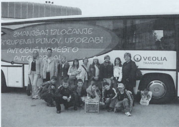
Bili smo tretji v Sloveniji

Z učenci 5. a razreda smo bili prijavljeni na mednarodno tekmovanje »Skice okoli sveta«, katerega namen je dvigniti zavest otrok za varovanje okolja. Projekt je organiziran pod pokroviteljstvom UNESCO-ve francoske nacionalne komisije.