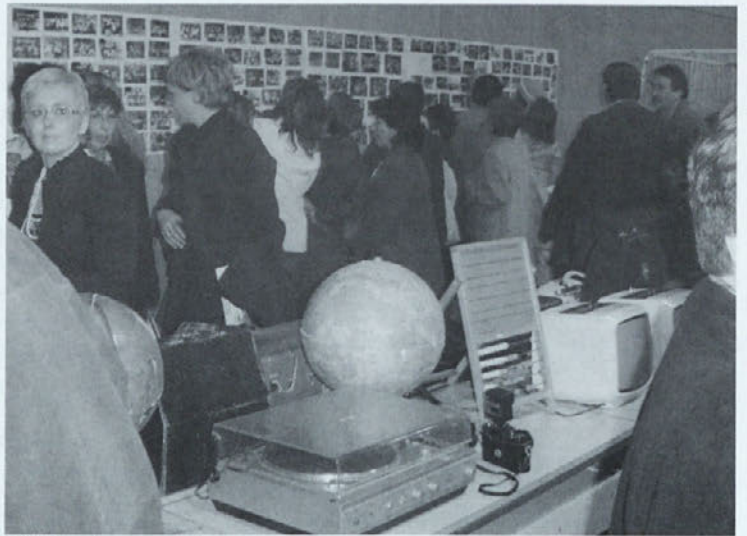
Utrinek z razstave