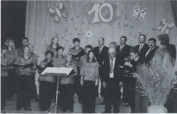
Nastop domačega pevskega zbora

10. junija 2006 je MePZ KUD-a dr. Anton Slodnjak v kulturnem domu v Juršincih praznoval svoj deseti jubilej.