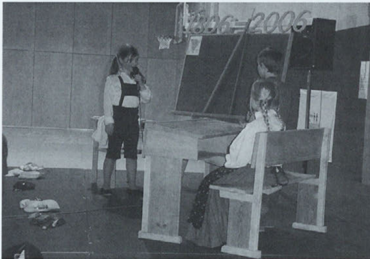
Utrinek s proslave

Marec 2006 je bil zelo pomemben v zgodovini naše šole. 8. marec 1806 je datum začetka rednega šolstva v nekdanjem Sv. Lovrencu v Slovenskih goricah.