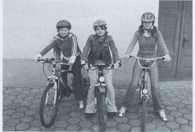
Kolesarke po Puhovi poti