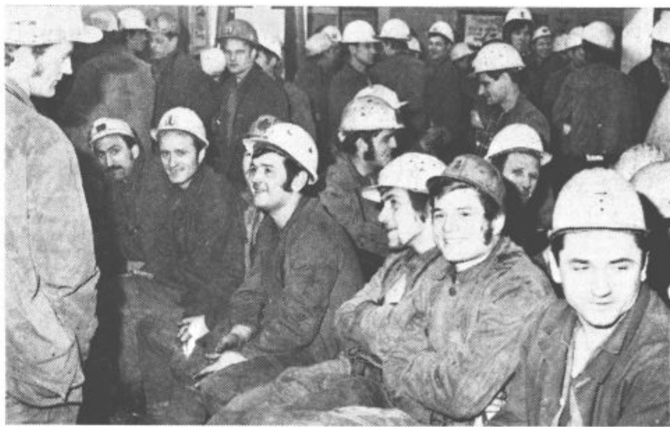
PRIPRAVE ZA ZDRUŽITEV — V velenjski občini pospešeno tečejo priprave za združitev energetskega gospodarstva. Pobudo za to so oktobra lani dali komunisti rudnika, termoelektrarne in rudarskega šolskega centra. Delovna komisija akcijskega odbora je že izdelala delovni osnutek oziroma predlog samoupravnega sporazuma o združevanju TOZD v delovno organizacijo in tudi osnovna izhodišča samoupravnega sporazuma za javno razpravo. Ko bodo oba dokumenta dopolnili s pripombami, bodo drugi mesec v elektrarni in na rudniku sklicali zbornice delovnih ljudi, na katerih bodo potem odločali o integraciji. — Podrobnosti preberite na 2. strani.

11. januar 1974 • Leto X., št. 1 (210) • Cena 1 dinar • Poštnina plačana v gotovini