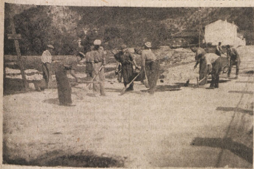
Vipavčani so v nedeljo popravljali cesto, ki vodi skozi trg.

voljni delavci, delovne brigade naj si vzamejo za vzor vipavsko mladino, ki je sklenila, da potem štafete prinese vedno poročila z vseh vasi na okrajno središče po končanem prostovoljnem delu, to se pravi, da je ta vipavska mladina pokazala, da je razumela važnost obveščanja vseh, kaj in kako se dela pri njih in koliko so že z delom dosegli. Vsak se mora pri nas vprašati, zakaj pa o nas ničesar ne piše v časopisju, ko