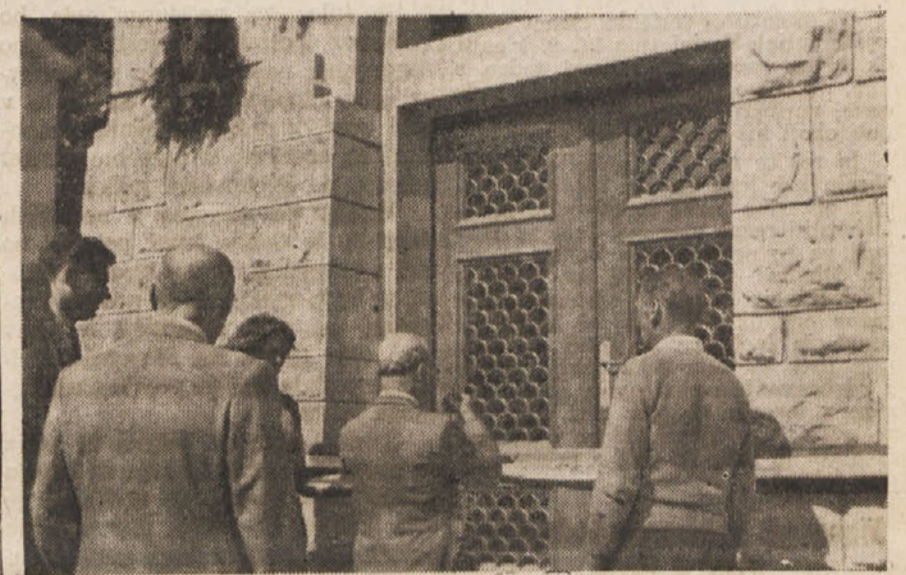
Slavnostna otvoritev zdravilišča v Senožečah.

ali prebelili so skupno 202 gnojišči. Nadalje so počistili 297 dvorišč in predstanovanjskih prostorov. Zanimivo je tudi, da je prav grgarski okraj ustanovil pet ambulant. Poleg tega