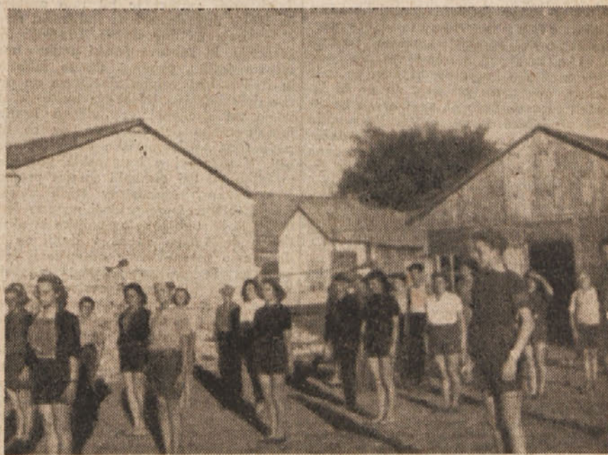
Brigada »Srečka Kosovela«, ki je dosegla pri delih v Prestranku lepe uspehe, je gojila tudi fizkulturo.

1. oktobra se je mladina brigade poslovila od delavcev in domačih prebivalcev in odšla na svoje domove. Ker so bili mladinci in mladinke brigade vsi skupaj zelo vztrajni in požrtvovalni pri delu in tudi pri učenju, je brigada proglašena za udarno.