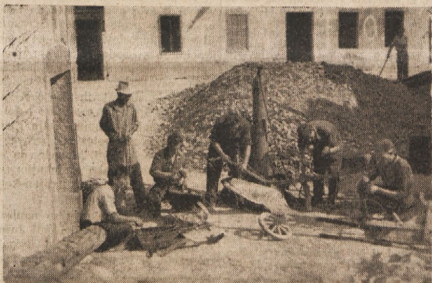
Naš delavec je povezan s kmetom. Delavci ajdovskega Avtopodjetja popravljajo kmetom orodje v vasi Cesta.

vse se je grmadilo v naših zasilnih delavnicah in delavcem so prav tako žareli obrazi od veselja in občutja, da pomagajo tistim kmetom, ki so v času naše narodnoosvobodilne borbe žrtvovali prav vse za našo skupno svobodo.