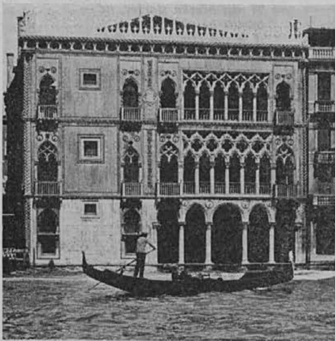
Benetke — palača in značilna gondola