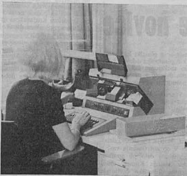
Delo na luknjarno-verificirnem stroju