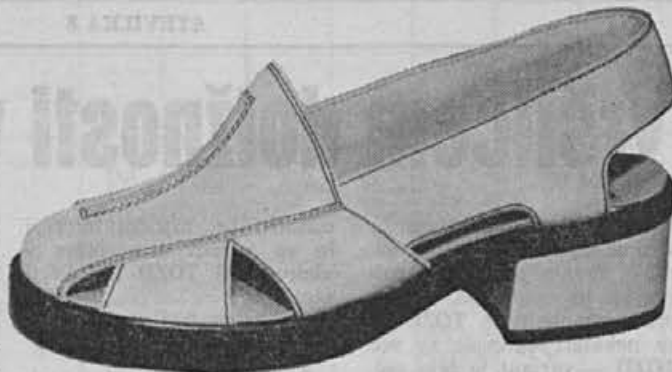
Ta model iz skupine ženskih sandal iz kolekcije pomlad-poletje 74 smo najboljše prodajali