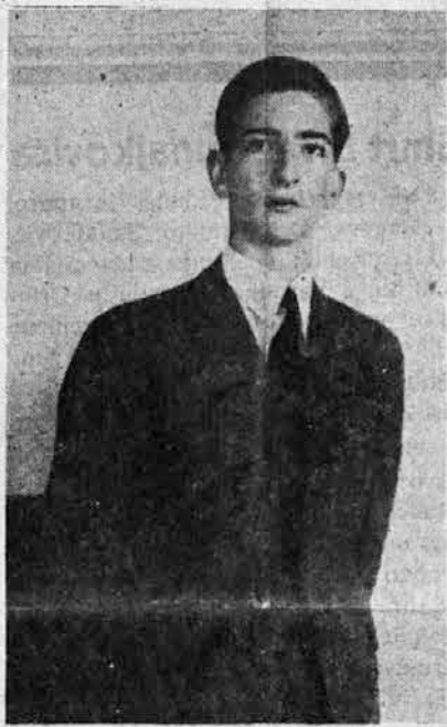
Nj. V. Kralj Petar II.

I ove godine izvršena je tradicionalna svečanost prenošenja badnjaka u Dvor na Dedinju, kojoj su prisustvovali Nj. Vel. Kralj Petar II, Nj. Vis. Knez Namešnik Pavle i članovi Kraljevskog doma. Pored vojske, u povorci je učestvovala i povorka građana, zatim predstavnici raznih viteških organizacija, među