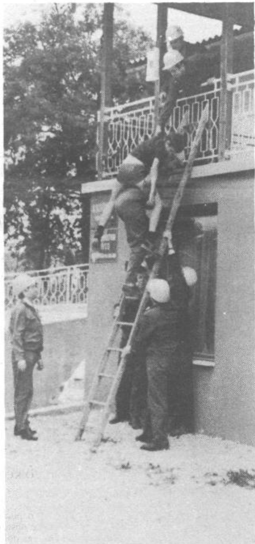
Previden prenos iz »porušene« hiše

VAJI CIVILNE ZAŠČITE NA TEMO »RUŠILNI POTRES«