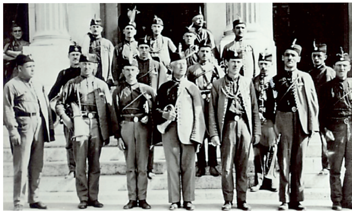
Člani središke sokolske godbe leta 1932, ki so se udeležili vsakoletnega zleta v Sarajevu.