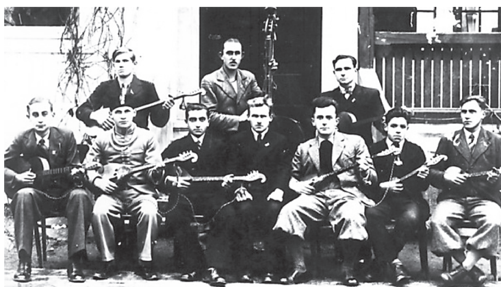
Tamburaši sokolskega društva iz Središča ob Dravi.