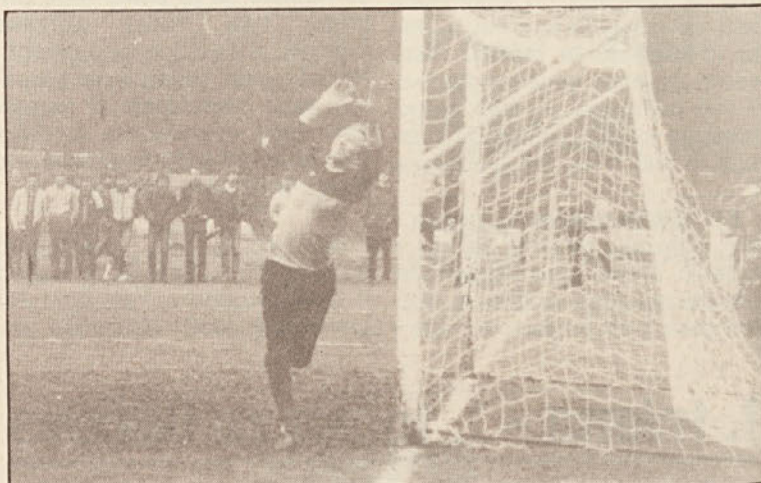
Vratar Železne Kaple se zamašan trudi ubraniti Hrovatičev prosti strel. Žoga gre nedosegljivo za njega v gol.