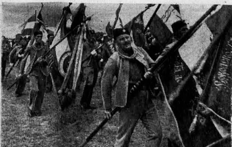
Sokolske zastave u povorci na Kosovskoj svečanosti

Svečanost je počela liturgijom u Gračanici, na kojoj je činodestvo- vao Nj. Sv. Patrijarh Gavriilo, a za