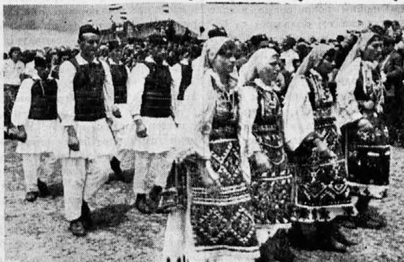
Seoski sokoli i sokolice na sletu na Kosovu

Slovački pretседnik vlade, Dr. Tiso je održao pred par dana u Trenčinu govor, u kome je ponovo napao propagandu letaka i šaputanja koja se širi u Slovačkoj protiv sadašnjeg stanja. Rekao je da je i u samom Trenčinu otkrivena potajna štamparija, gde su se fabrikovali takvi letci, te da zna za čitav niz kavana i krugova, u kojima se vodi akcija protiv vlade i napada se Nemačka. Zapretio je, da prevratnici moraju da drže jezik za zube, jer da je slovačka vlada u stanju da ih najstrožije kazni.