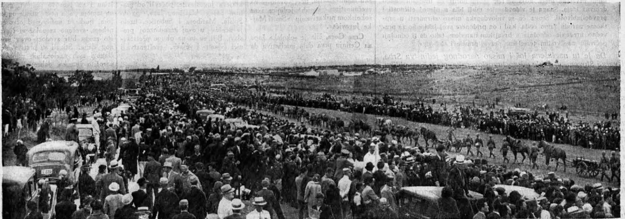
Veliki defile vojske, sokola i viteskih udruženja na Kosovu polju

И поред ружног времена рачуна се да је поред Сокола било око 2000 других слушалаца.