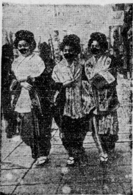
V mrzlih zimskih dneh nosijo lade dame v Tokiu kosček papirja, ali tenkega blaga pred ustmi