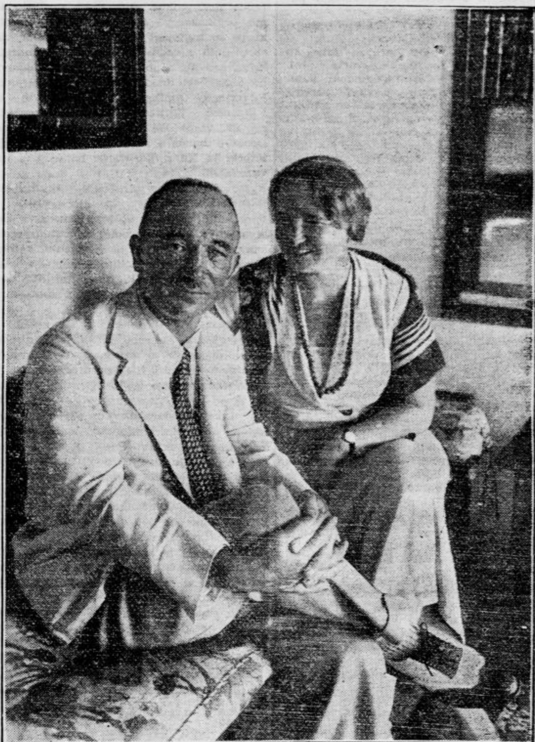
Vnanji minister dr. Edvard Beneš (s svojo soprogo), ki ga je bivši državni predsednik T. G. Masaryk priporočil za svojega naslednika