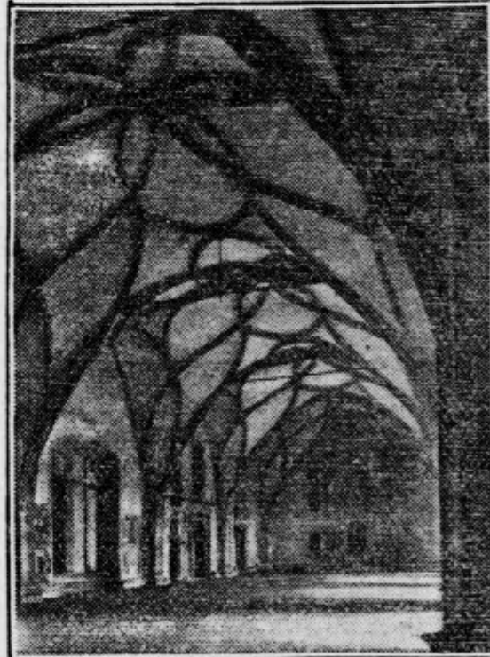
Vladislava dvorana, kjer bo danes izvoljen novi predsednik českoslovaške republike

V Parizu imajo ta čes razstavo demantov, ki so jo bogato založili s pošiljkami iz domačih in tujih krajev. Najlepši razstavniki kos predstavljata veliki demant, ki so ga l. 1895. našli v Transvalu in so mu pozneje na čest jubileja kraljice Viktorije dali ime »Jubilejni demant«. Veliko pozornost zbujata tudi »Nasaka«, ki je bil nekoli last nekoga indijskega duhovca in je danes med najlepšimi kamni v angleški kronski zbirki. Mnogo pa je tudi demantov, ki so jih našli v najnovejših časih in ki so med drugim zanimivi po tem, ker kažejo, da se danes vse drugače brusijo in fasetirajo nego nekoli.