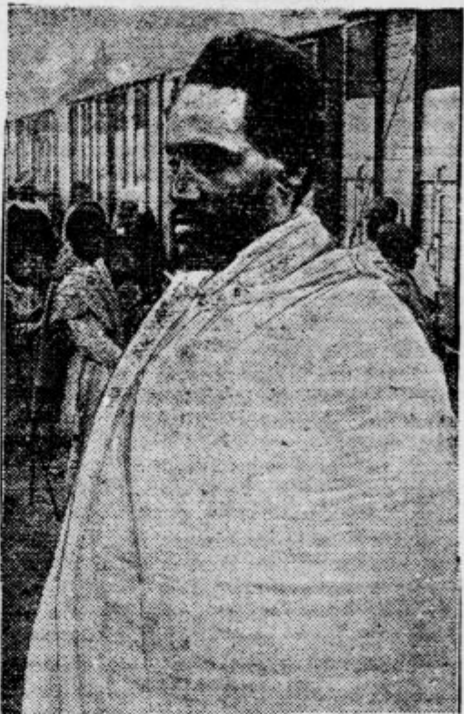
Abesinski vojskovodja ras Desta, poveljnik desnega krila abesinske južne armade