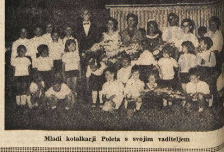
Mladi kotalkarji Poleta s svojim vadieljem