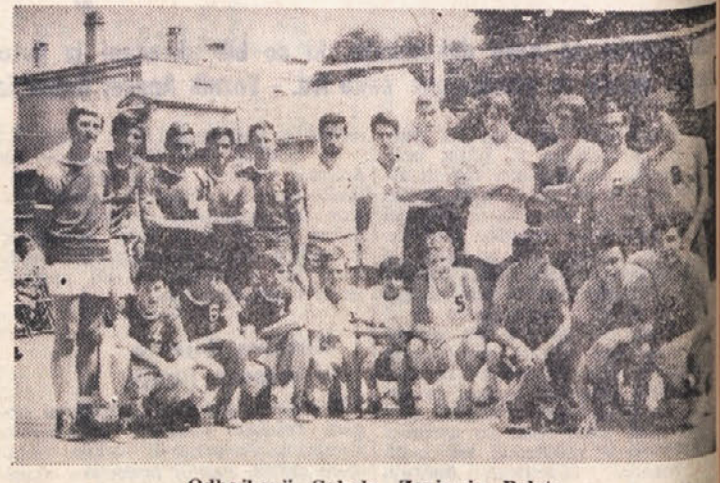
Odbojkarji Sokola, Zarje in Poleta

Športno društvo Breg sklicuje danes, 16. VII. 1968 ob 21. uri na društvenem sedežu prvo sejo novoizvoljenega odbora. Zaradi navzočnosti prosimo odbornike, da se seje točno in polnoštevilno udeležijo.