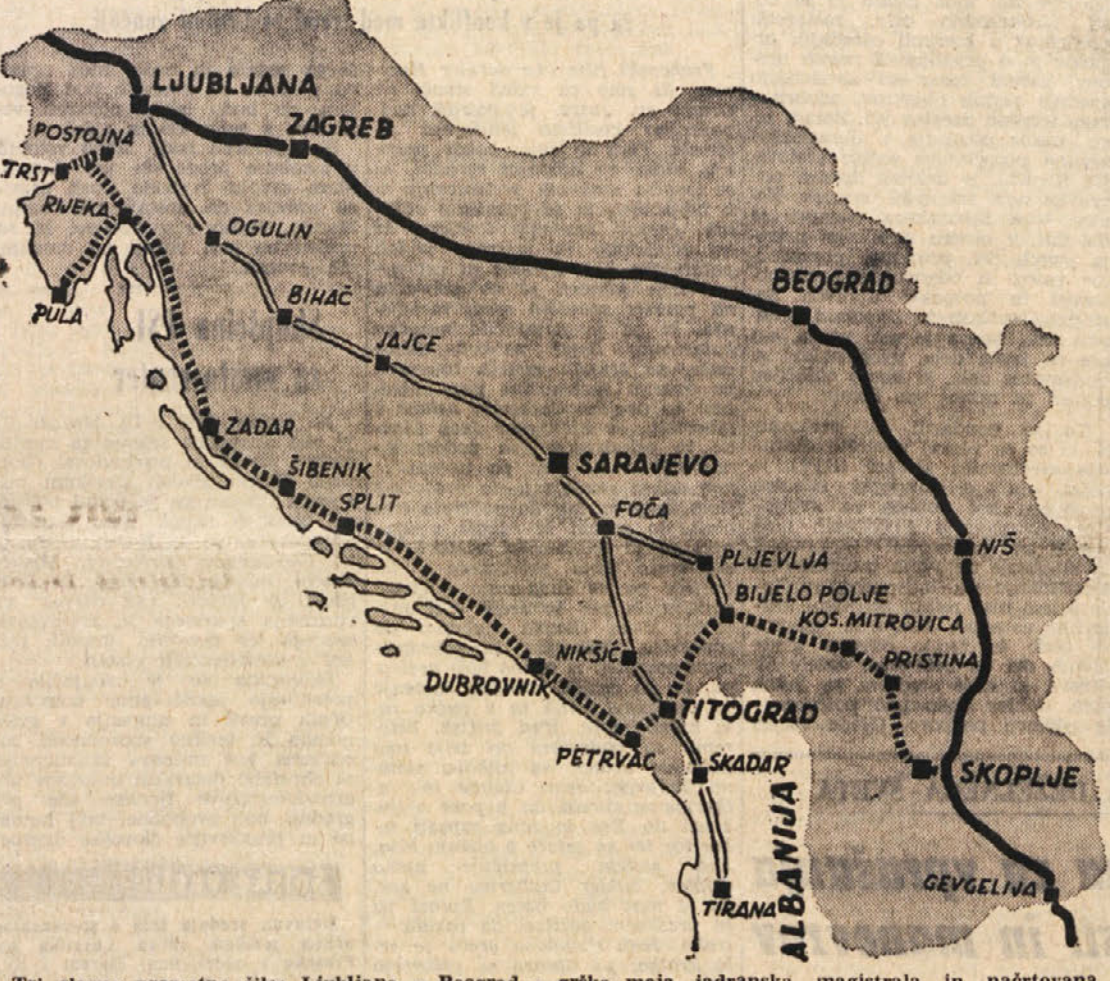
Tri glavne prometne žile: Ljubljana - Beograd - grška meja, jadranska magistrala in načrtovana južna magistrala

Magistrala bo povezovala tiste predele osrednje Jugoslavije, ki so sedaj še odrezani od glavnih komunikacij