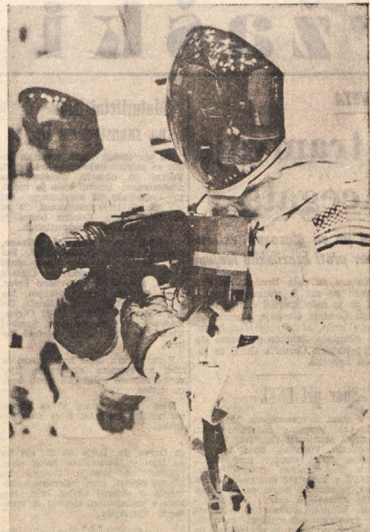
Ameriška kozmonavta Armstrong in Aldrin v kompletni opravi, v kateri bosta stopila na Luno. Aldrin drži v roki tv-kamero.

Končno je za kozmonavta - rudarja, ali če hočemo geologa, predvidena še tretja faza zbiranja kamnov in rudnin. Ker je za astronaute kljub številnim nalogam vendarle čas obilno odmerjen, si bosta Armstrong in Aldrin mogla napraviti tudi lastni zbirki in glede tega jima ni ukazano, kako naj se opnešata, pač pa jima je prepovedano na voljo, da si na Luni izberejo tisto, kar se jima zdi najbolj primerno ali zanimivo. Dosegli smo navedli dve vlogi, ki ji bosta izpeljala pogumna ameriška kozmonavta Aldrin in Armstrong. Toda ameriška kozmonavta nista bila še veliko drugega dela. Sicer je bilo obiljubljeno, rekli bi zagotovo, da se bo osvajanje Lune posredovalo preko televizije po vsem svetu. Dosegli so sporodili, da bosta obilni dve tretjini človeštva spremljala ta največji dogodek našega stoletja. Pri tem pa velja poudariti, da je zelo verjetno, da bo prebivalstvo Zemlje videlo kozmonavta Armstronga in Aldrina, ko bosta že kar trdno na Luni. Prva najbolj kritična faza, kot jo ocenjujejo izvedenci, pa naj bi bosta pristala na Luni 102 uri nazaj, je naročeno, da najprej fotografirata okolico in nabereita nekaj vzorcev oziroma rudnin in šele nato postavita anteno, s čimer bosta izboljšala povezavo z Zemljo in omogočila tudi televizijski prenos.