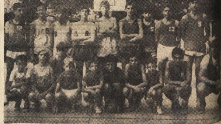
Naraščajniški košarkarji Poleta in Mivarja