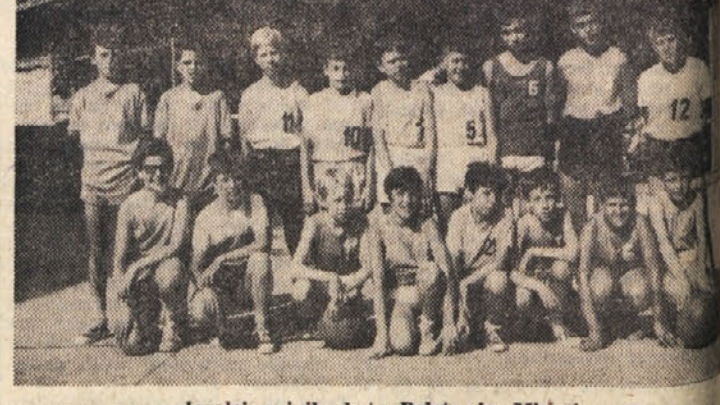
Igralci minibasketa Poleta in Mivarja