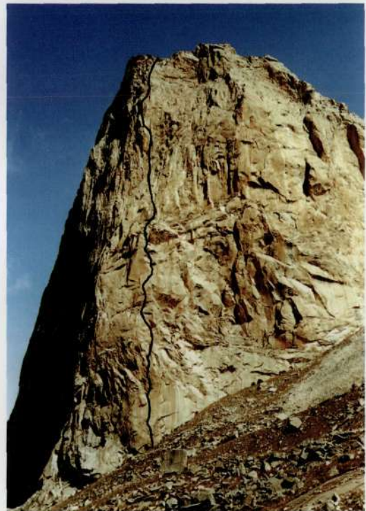
El Estinge (5325 m) z včrtano smerjo Cruz del Sur (Južni križ)