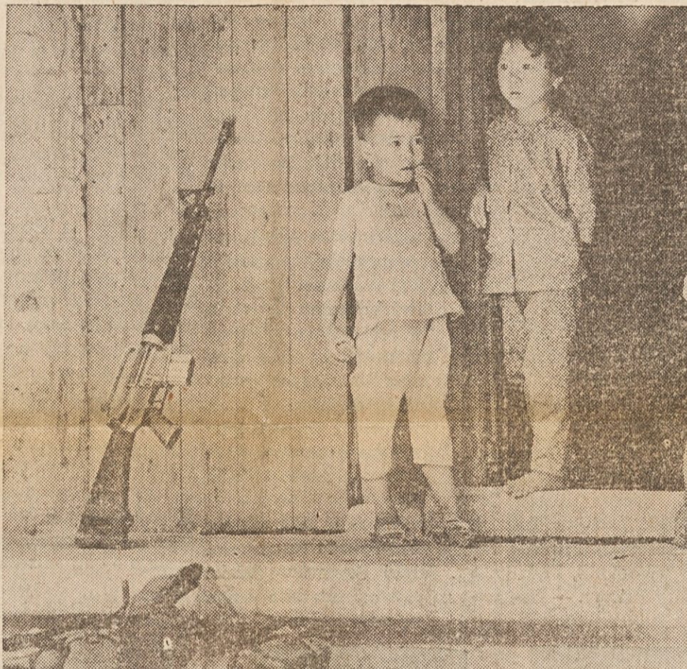
VOJNA JE VSAKDANJOST — V Vietnamu je postala vojna nekaj tako običajnega, da niti otrok ne zanima več vojaška oprema, kot kaže zgornja slika, posneta v Tay Ninhu v Južnem Vietnamu.