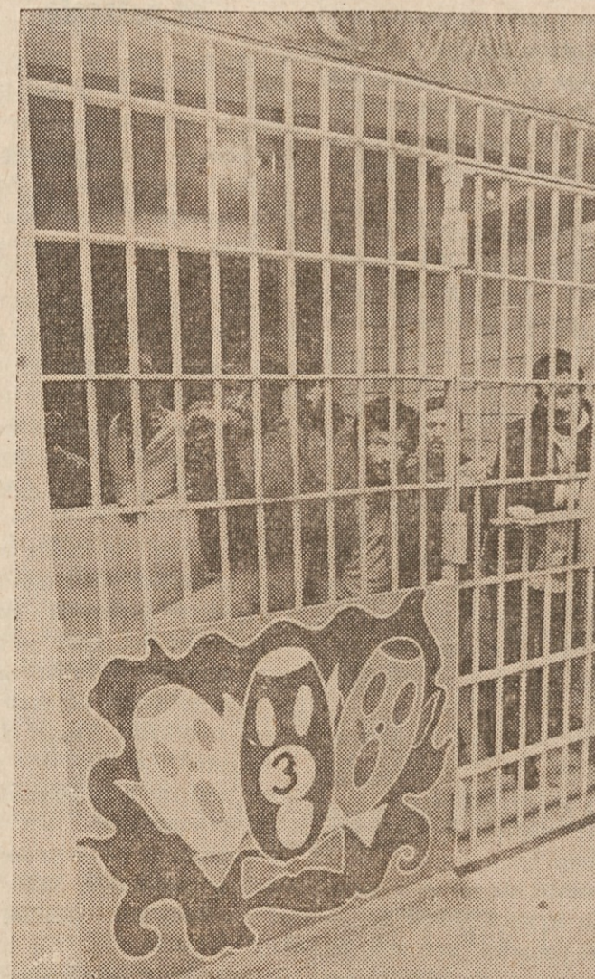
ZA LAŽJO RAZPOZNAVO — Nekdo je na vrata jetniške celice v Brooklynu, N.Y., napravil "umetniški napis" s številko celice. V njej je zbrana kar čedna družčina, o kateri so varnostni organi prišli do zaključka, da ne spada na svobodo, ampak za železno mrežo.