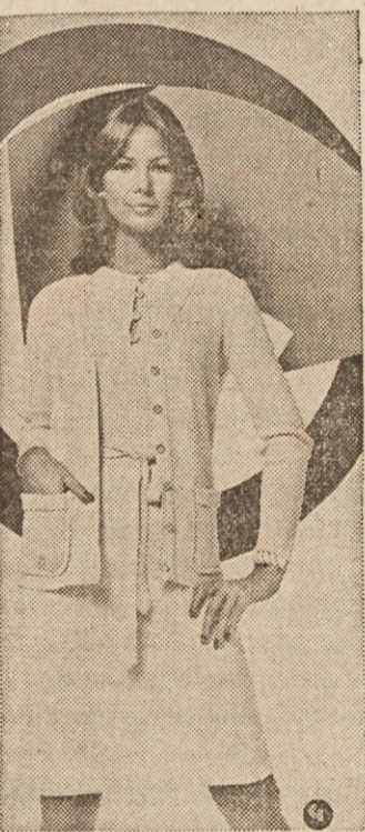
SLEEK —Classic good looks for town or travel are depicted in this softly-layered sweater dress of all-cotton string knit. A long-sleeved cardigan tops a short-sleeved dress with ribbed knit top. It's by Dividends, division of Larry Aldrich. The fabric's from Novelty Textiles.

te, pa se takoj razveseliš..." "Pusti ga," se je oglasil oče, "ker je slabe volje."