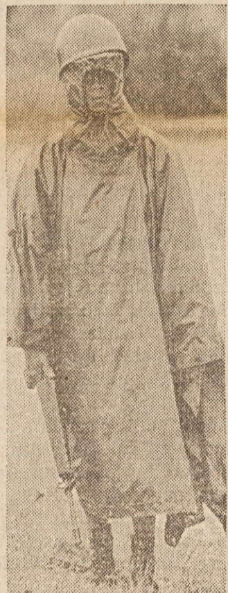
ZALOSTNA SLIKA — Vietnamski marin ogrnjen v šotorsko krilo na straži v bližini mesta Hue v Južnem Vietnamu. Vojaška služba že tako ni prijetna, v dežju in vetru pa še prav posebno ne, pa četudi je treba stati le na straži.

"Pojdi, Stanko," je dejal in potegnil brata za roko. "Dež je tako topel, joj!... Samo spere