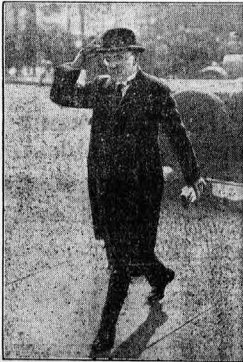
Nemški državni kancler dr. Brüning Nemški državni kancler gre na prvo sejo novoizvoljenega nemškega državnega zbora

Med ponarejenimi rokopisi je znan »kraljičino-dvorski« rokopis, ki so ga prevedli celo v 12 jezikov, dokler niso Masaryk, sedanjí predsednik češkoslovaške republike, in nekateri njegovi tovariši dokazali, da je ponarejen.