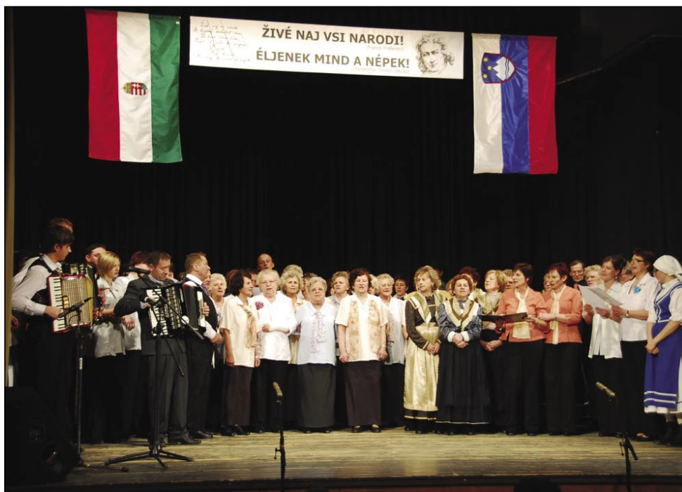
Na konci so vsi nastopajoči zaspejvali domanjo nauto »Lejpa naša domovina«