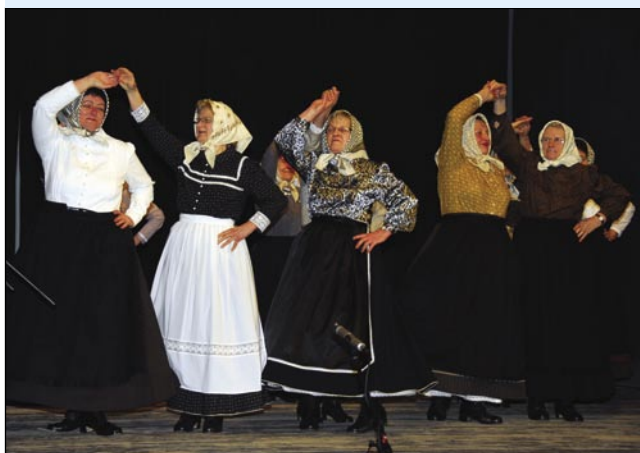
Folklorna skupina DU