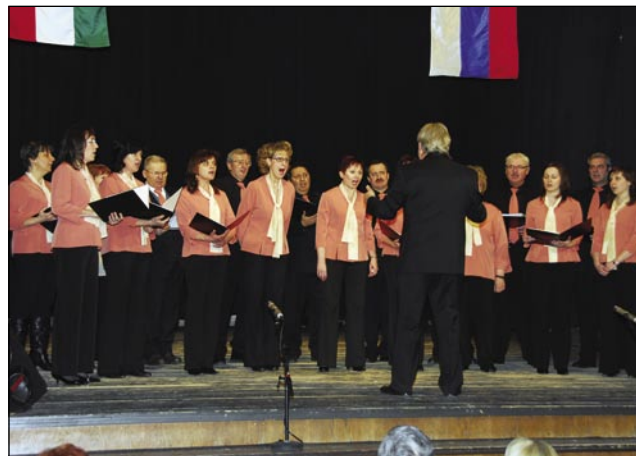
Komorni pevski zbor Monošter