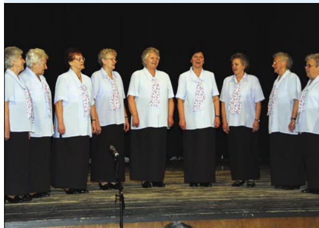
Ljudske pevke Monošter