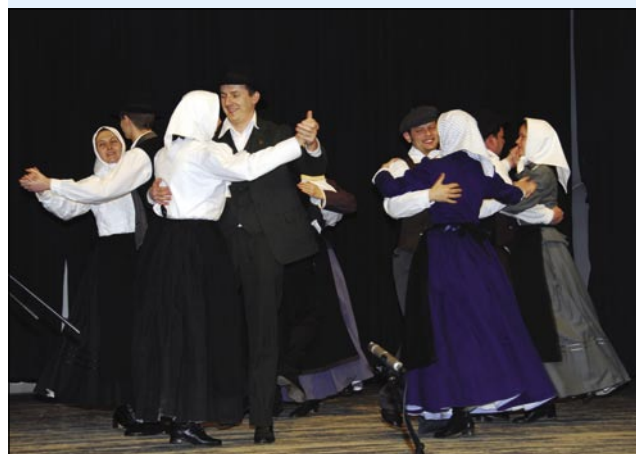
Folklorna skupina Sakalovci