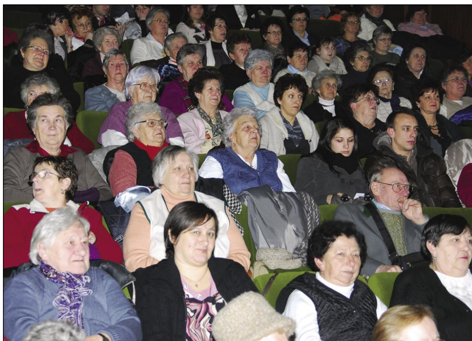
Gledalci so lepau napunili gledališko dvorano

rabja, kama je vsikder rad prišo pa eške pride, če leko.