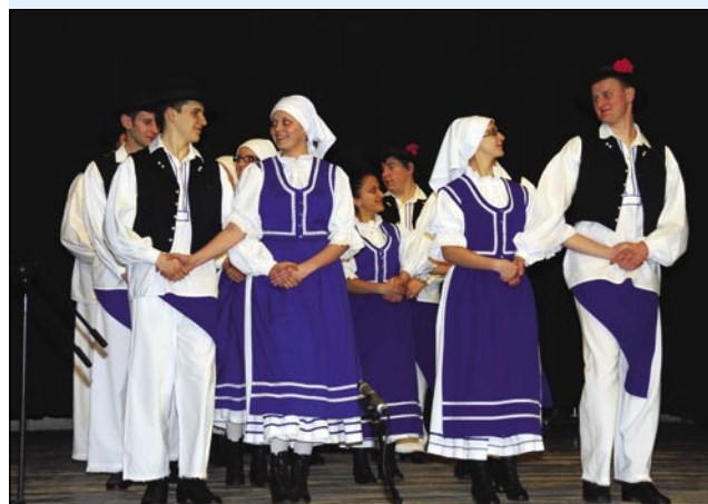
Folklorna skupina Gornji Senik