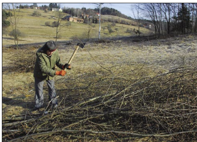
»Hvala baugi, zdravdje ešče do tejga mau tak kak tavala,« pravijo Vajnin Kari pa tadale klestijo veje

»V künji smo špajert meli, v iži pa črpnjena kala, te so dobra bile, zato ka so toplo-