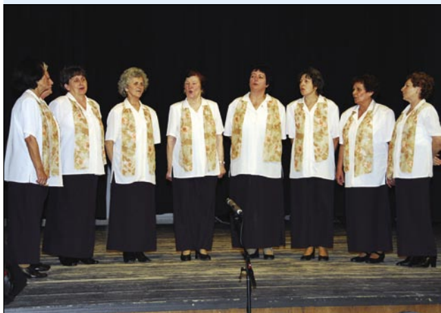
Ljudske pevke Števanovci