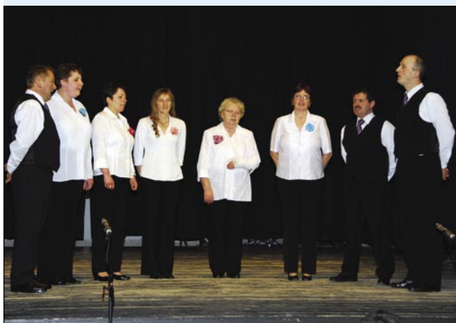
Ljudski pevci Gornji Senik