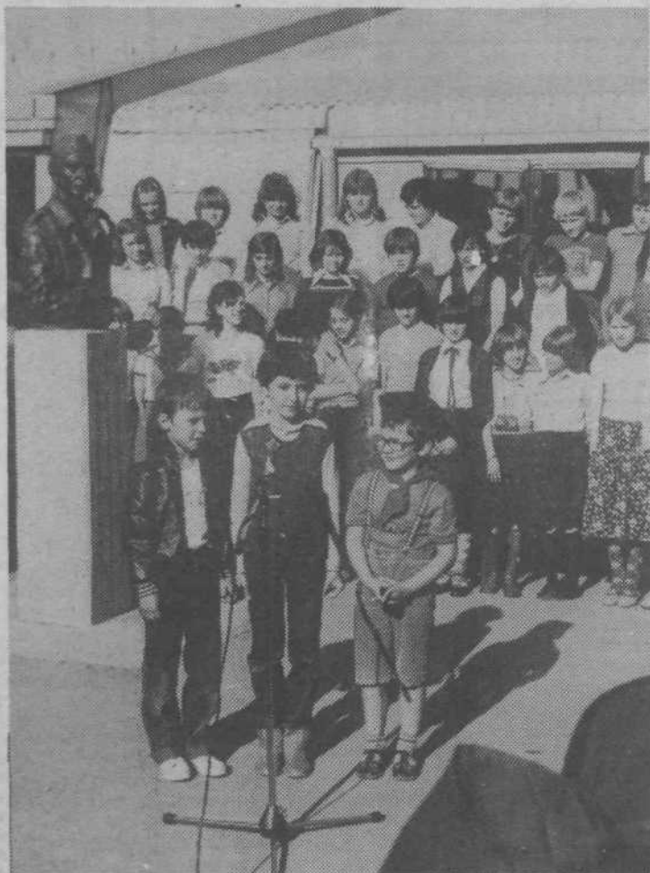
Kurirčkova pošta pred OŠ Karla Destovnika-Kajuha