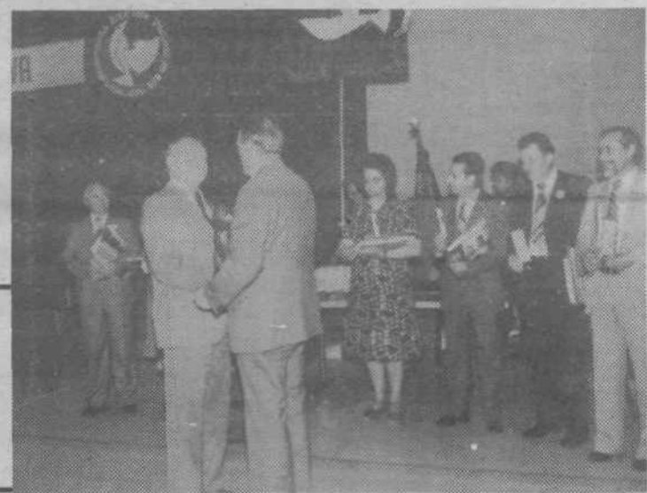
Svečani trenutek na zaključni prireditvi 21. maja v športni dvorani na Kodeljevem, združeni z občinskim praznikom dneva mladosti: predaja goloba, simbola Srečanja prijateljstva