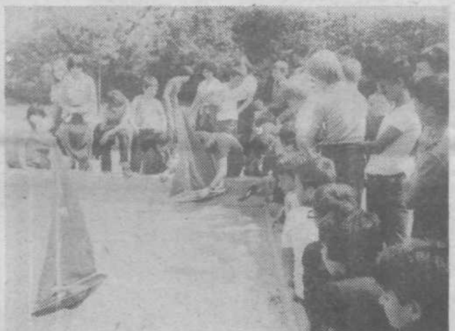
Modele jadrnic so mladi tehniki predstavili v malem bazenu na Vevčah