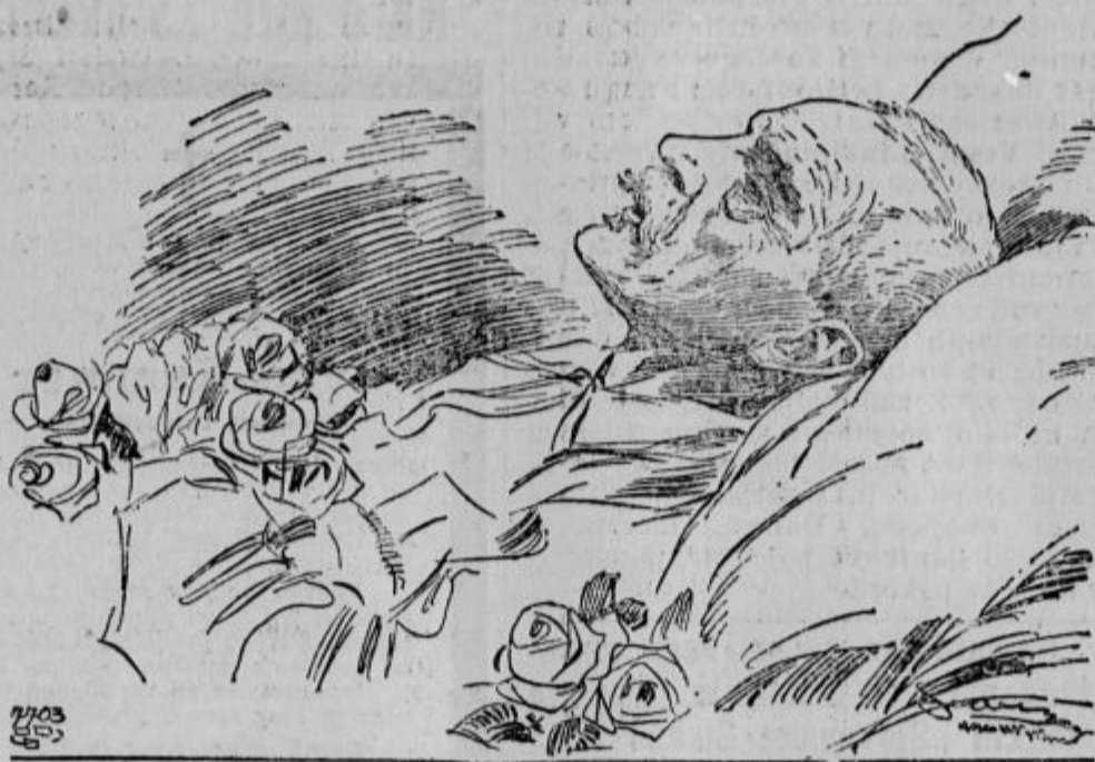
Graf Aehrenthal na mrvaškem odru.