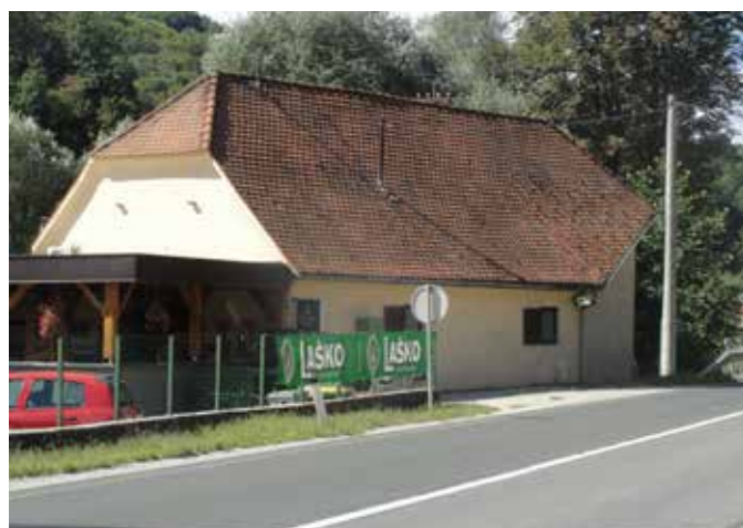
Nekdanji Opoški mlin