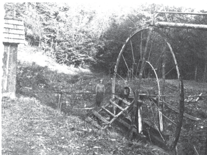
Kandolov mlin