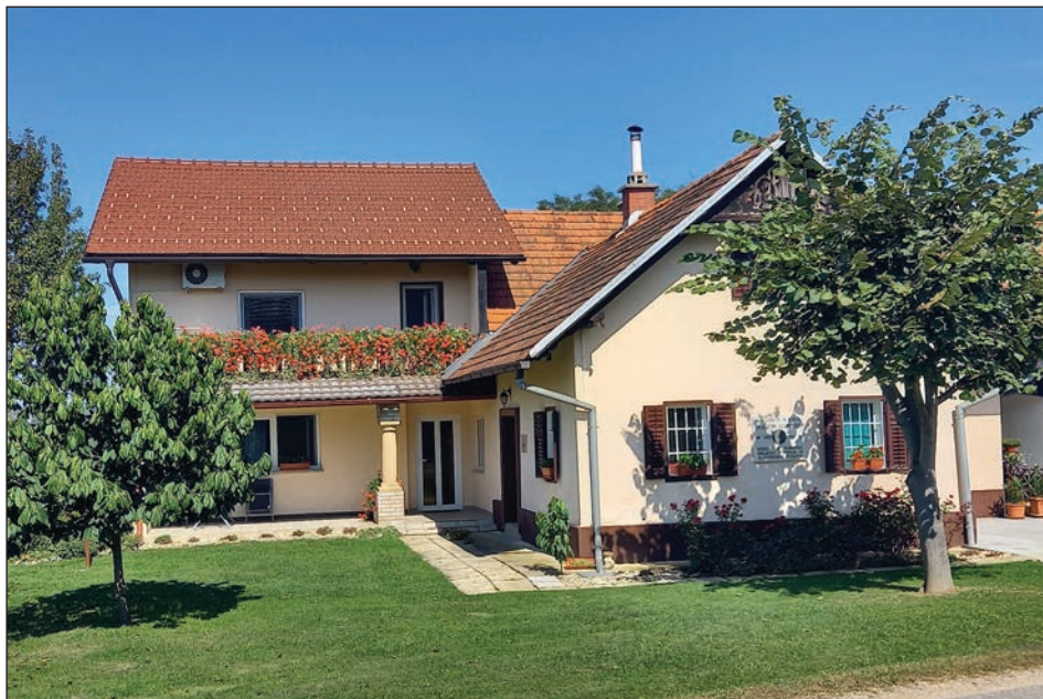
Slika 1: Koroščeva domača hiša v Biserjanah (september 2020) (Foto: Martin Bele).

kupila hišo v Biserjanah 7 (danes nosi hiša številko 20) in v naslednjih letih tam ustvarila družino. Tamkajšnje domače ime je bilo pri Bežikovih (oz. Bižikovih), Anton je bil v svojih otroških letih znan torej kot Bižikov Tonček (Ahčin, Godeša & Dolec, 1999, 217; Farkaš, 1941, 8). Domača hiša stoji še danes (s prizidkom).