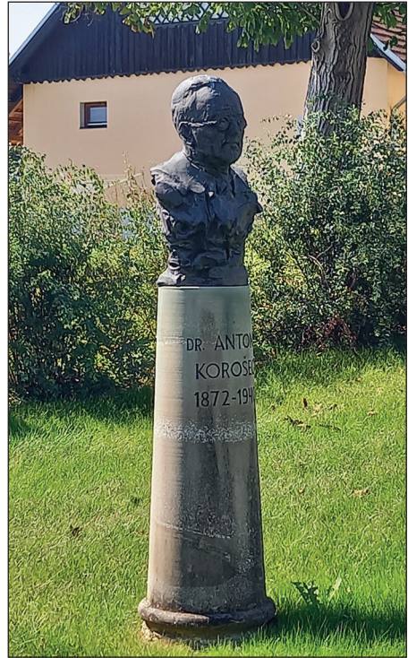
Slika 2: Kip Antona Korošca v Sv. Juriju ob Ščavnici (september 2020).

Kot zanimivost naj na tem mestu dodamo tudi to: Za šolsko leto 1886/87, ko je Korošec v Mariboru obiskoval tretji razred, najdemo med učitelji njegovega razreda (za nemščino, zgodovino in zemljepis) omenjenega moža, po imenu Leopold Pötsch. Pötsch je učil Korošček razred, kot kaže, le omenjeno leto in v