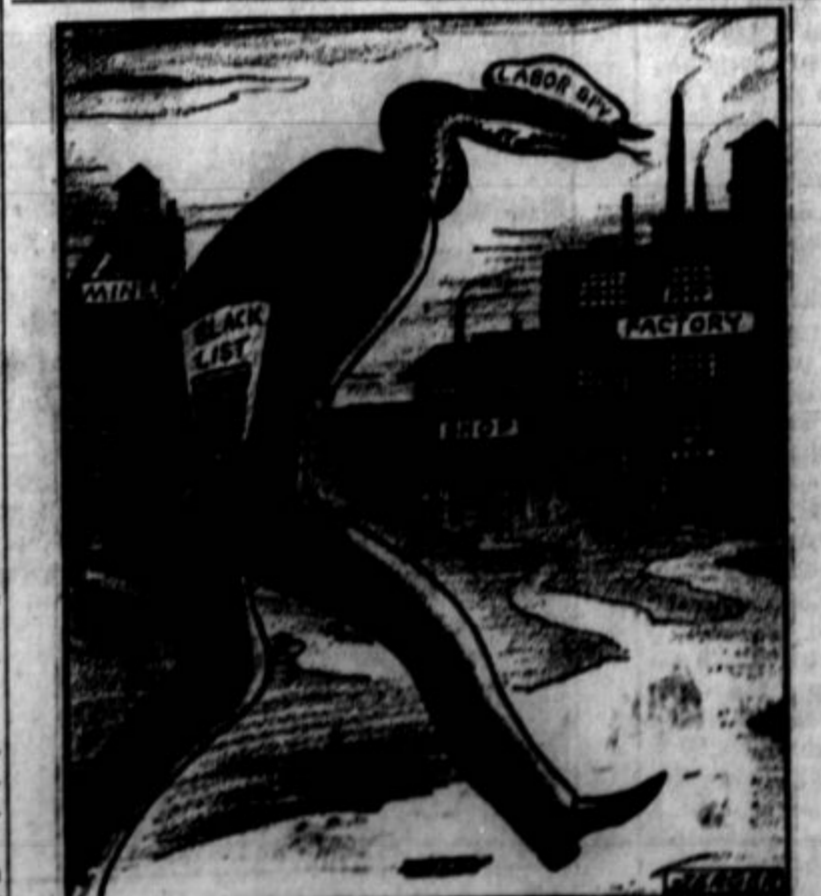
Kate v naši sredi.

Istanbul, 29. jun. — Moderna Turčija bo revidirala svojo zgodovino. Predsednik Mustafa Kemal je zaključil, da je stara koncepcija turške preteklosti nepačna in imenoval je odbor profesorjev, ki naj sestavijo novo zgodovino za turške šole.