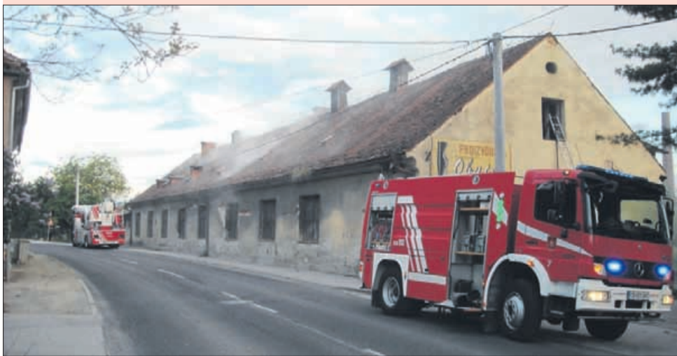
Za objekt na Teharski cesti je bilo le vprašanje časa, kdaj se bo kaj podobnega zgodilo.