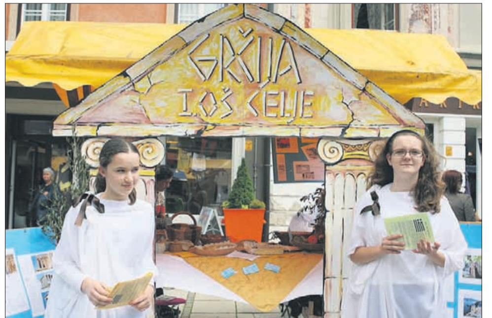
Učenci iz I. OŠ Celje so se izvrstno živeli v državo, ki so jo spoznavali med šolskim letom. Njihova stojnica je bila bogato obložena z izdelki, ki izvirajo iz Grčije. »Upamo, da se nobena država ne bo več znašla v takšnem položaju, kot se je Grčija,« so dejali učenci.

cev, obiskovalcev in drugih, ki so kakorkoli sodelovali. Pri pripravi projekta so šole sodelovale z veleposlaništvii, starši, občani in svojimi partnerskimi šolami v tujini.