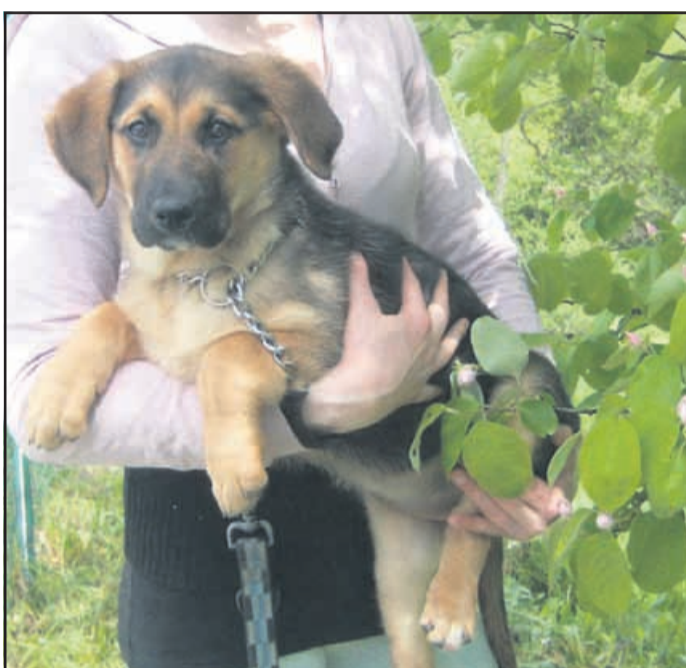
Malo me bolijo noge, saj sem ravno prišla z dolgega sprehoda. Za 3-mesečnega otroka je sprehod še naporna stvar, zato nas morajo ljudje večkrat nositi v naročju.