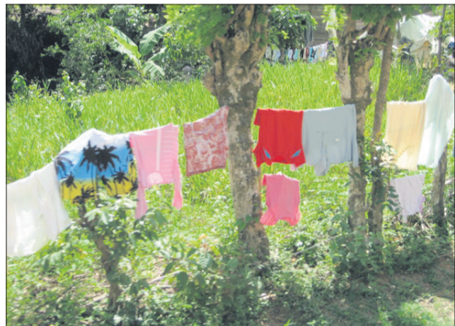
Če imate težave s senenim nahodom, potem v času cvetenja tudi perila ni dobro sušiti na prostem.

avtomobili ga še dvigujejo in pogosto se nabira v klimatskih napravah. Pri občutljivih se pojavijo simptomi pelodne alergije takoj, ko se začne vožnja z avtomobilom. Pojavi se srbenje v nosu, kihanje, iz nosu priteče vodena tekočina. Te in sluzi se ne moremo kar tako rešiti, saj se pojavi še vnetje očesne veznice, solze tečejo v potokih, v prsih se pojavi piskanje, oteče sluznica v ustih, izgubimo vonj in okus, lahko nas duši, tako da moramo, če jemljemo zdravila za astmo, celo povečevati količino le-teh. Pogosto to spremlja utrujenost, razdražljivost, glavobol, nespečnost, vnetje ušes, izguba apetita ... Seneni nahod se pokaže v najhujši obliki pri mladih in se z leti pogosto umiri, pri odraslem ima veliko lažjo klinično sliko. Je pa pogostejši v družinah, v katerih so že poznane različne oblike alergij, tudi kroničnega tipa.