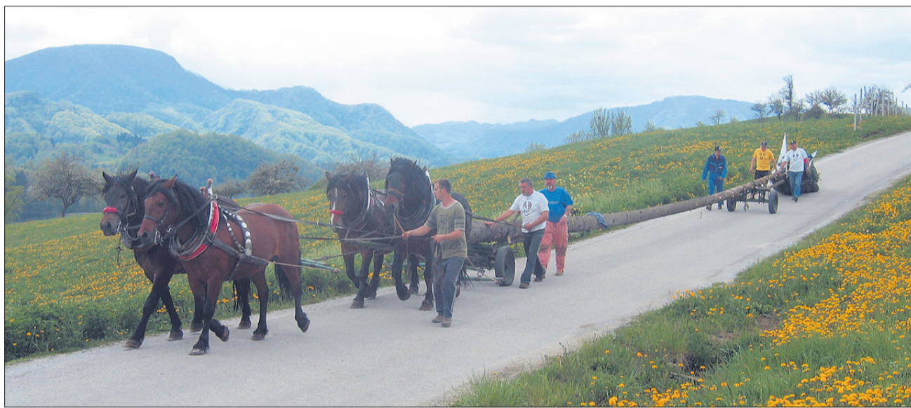
Po ravni cesti je šlo z lahkoto, druga pesem pa so bili ovinki, ki jih med Žigonom in Tevčami ne manjka.