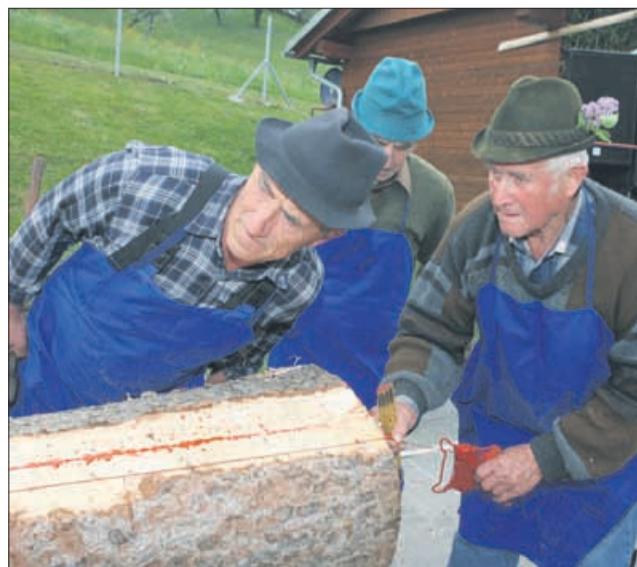
Takole se »vreže« sredina »šperovca.«