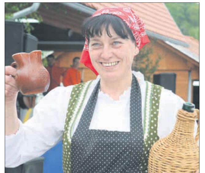
»Tole« je bilo edino plačilo delavcem.