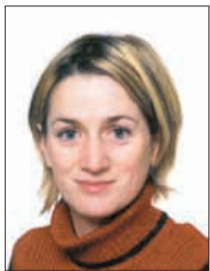
Piše: PAVLA KLÍNER

Za zdravilno rabo je primerno samo lubje. Od maja do julija nabiramo skorjo vej in mlajših stebel. Na zunanji strani je temno bleščča, na notranji pa svetlo oranžna ali rumenkasta. Sveže nabrane skorje nikoli ne uporabljamo, saj povzročajo draženje želodčne sluznice in bruhanje. Za uporabo jo moramo postarati, kar pomeni, da jo za čaj smemo uporabiti šele po enoletnem skladiščenju. Da se lubje iz rahlo strupenega spremeni v zdravilno, mora torej posušeno ležati vsaj eno leto, največ zdravilnosti pa dobi šele po