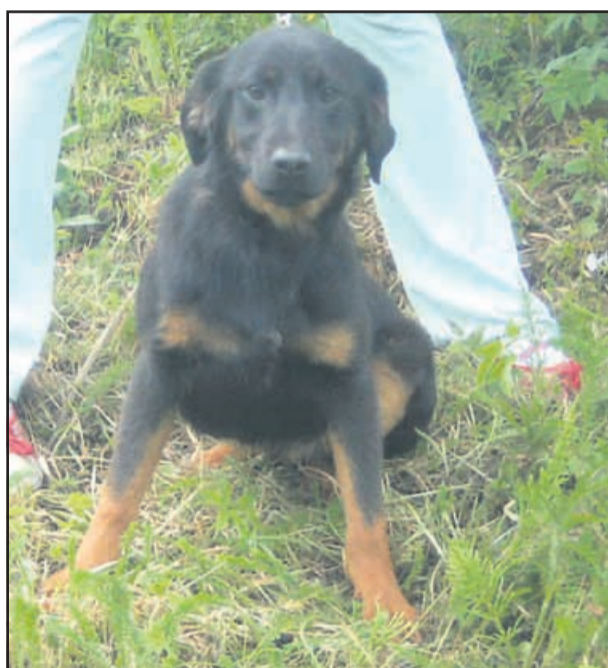
Živjo! Moje ime je Pina in v zavetišču sem že od svojega rojstva, to je od konca novembra. Zdaj štejem že 6 mesecev in že res nestrpnost čakam, da me posvoji dober človek.