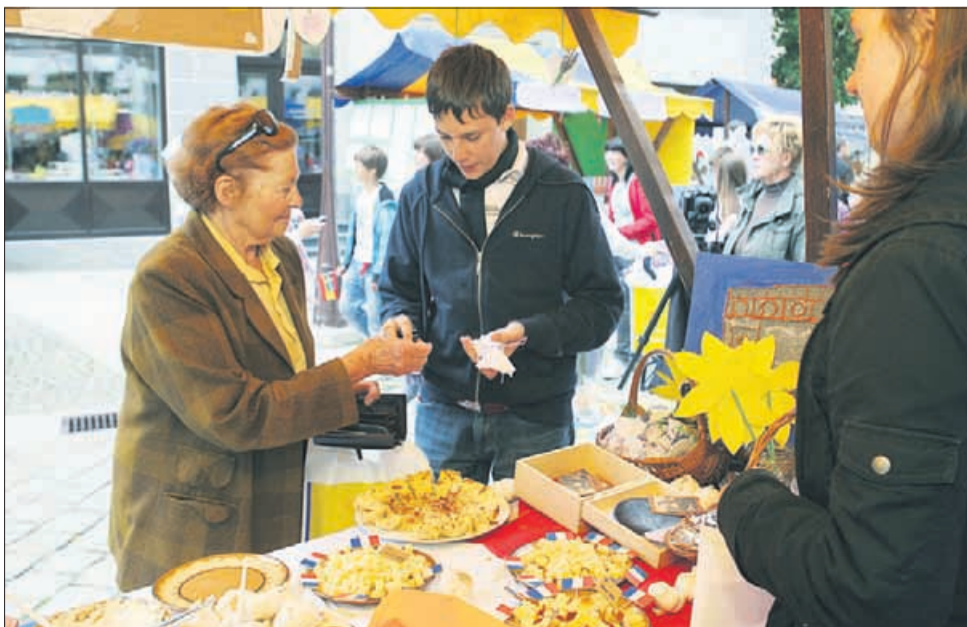
Največja gneča je bila pri tistih stojnicah, kjer so predstavljali kulinariko posameznih držav.