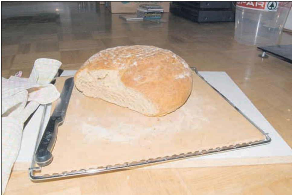
Ko kruh ni več svež, ga lahko »predelamo« v druge okusne jedi.