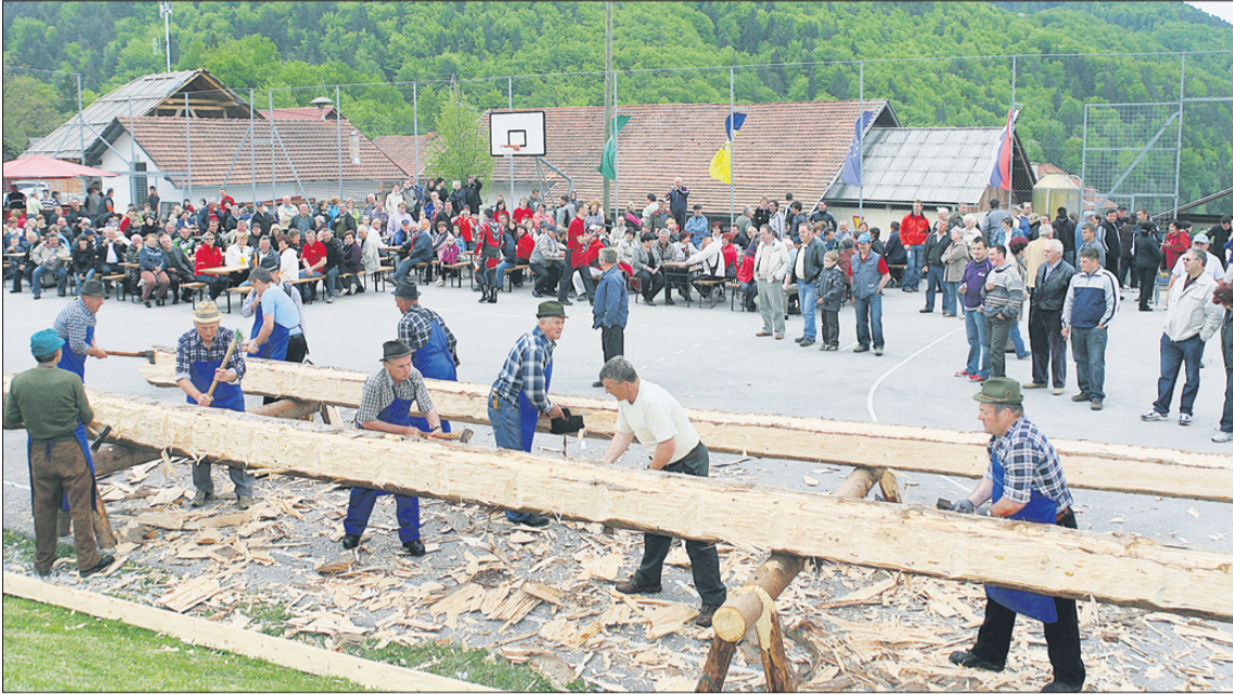
Takole je to šlo. Eni so krepko delali, drugi pa gledali!