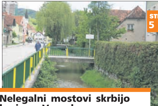
Nelegalni mostovi skrbijo krajane Vranskega