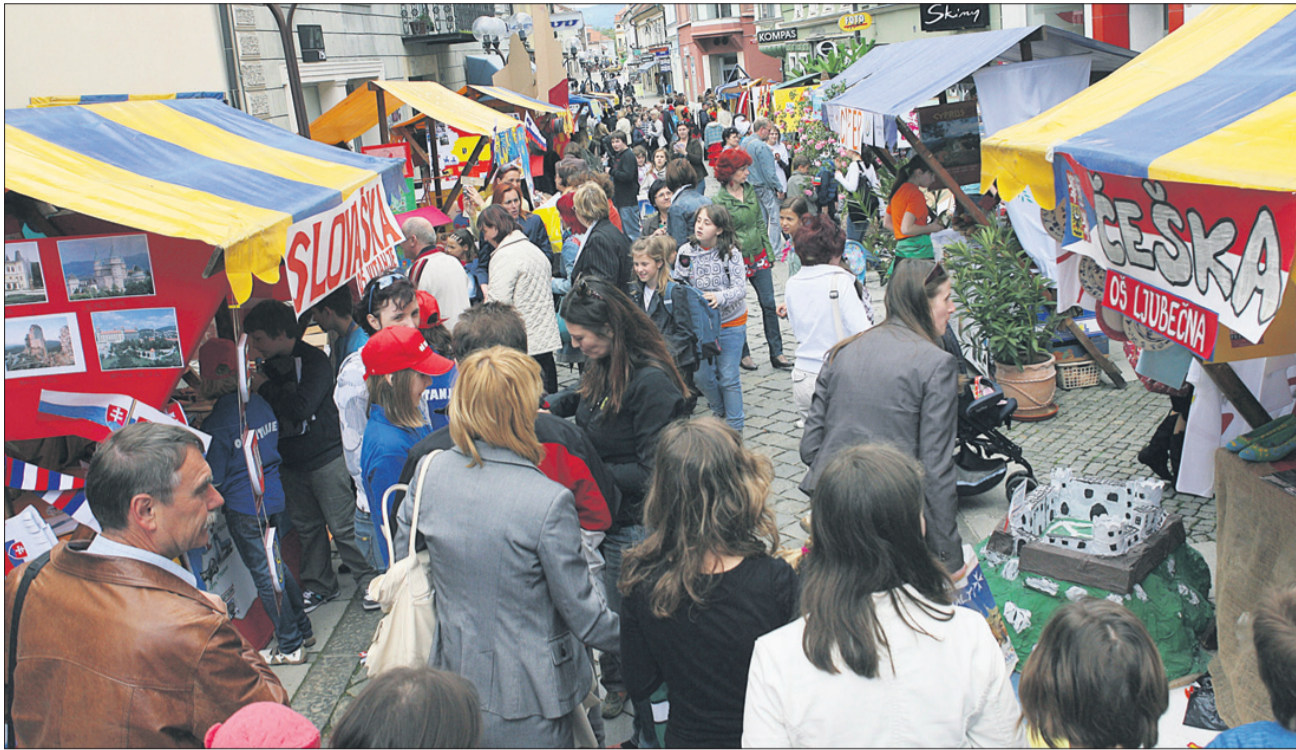
Na celjskem Glavnem trgu se je v petek trlo obiskovalcev. Mlado in staro si je prišlo ogledat Evropsko vas in kot so priznali mimoidoči, so nekatere države spoznali v povsem drugačni luči, kot so jih poznali prej.