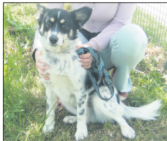
Koliko let bi mi prisodili? Eno, tri, deset? Vas moram razočarati, saj izgledam starejši kot sem v resnici. Star sem namreč 10 mesecev.

veterinarska bolnica šentjur www.vb-sentjur.si