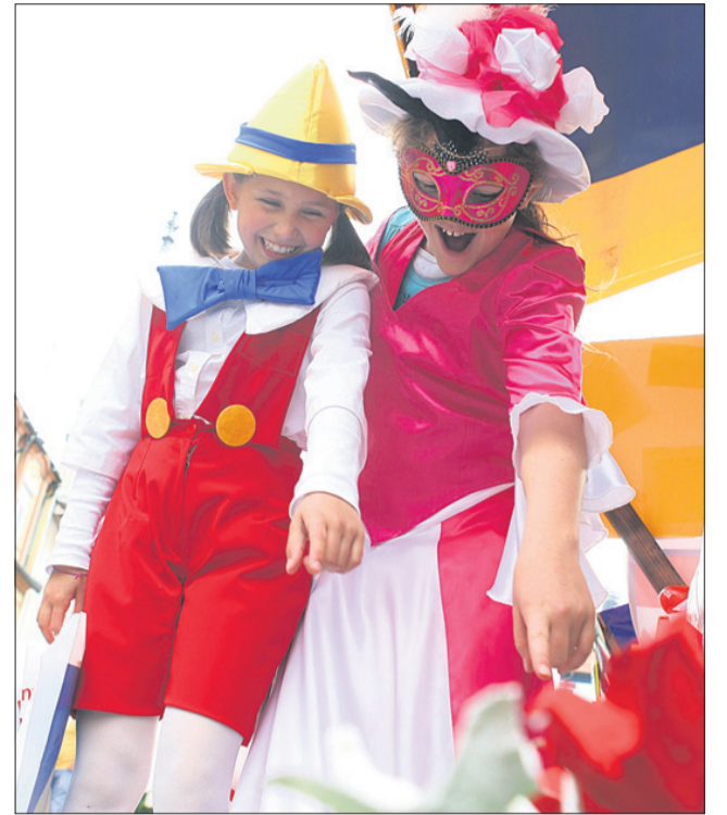
Otroci so se dobro znašli v kostumih