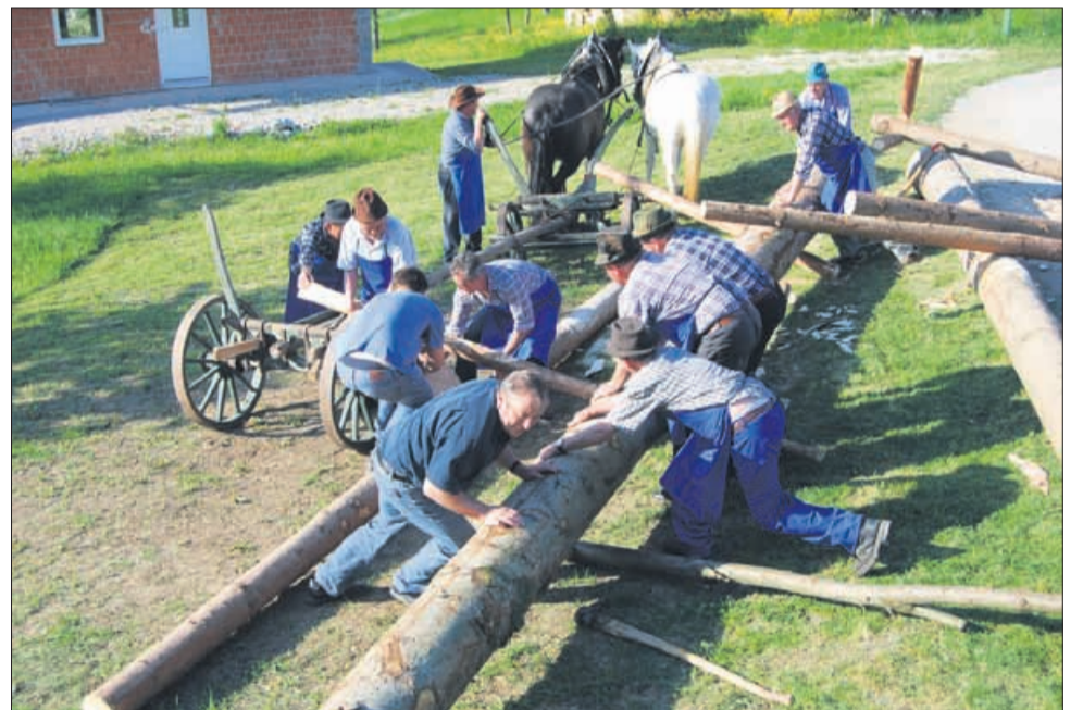
Mojstri so se ta dan dodobra namučili. A kot smo izvedeli, so se kasneje tudi dodobra poveselili. Še dolgo v noč ...