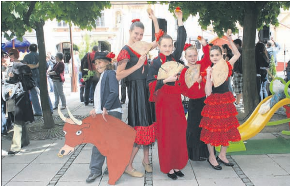
Bikoborec in mične plesalke iz Španije na celjskih ulicah? Ne, učenci IV. OŠ Celje.

cev in dijakov, ki jih je usmerjalo 1.738 mentorjev. Vsako leto je bilo v projekt vključenih približno 27 osnovnih šol iz širše celjske regije, pridružili pa so se jim srednje šole in številni drugi. Projekt je dosegel okoli 72.860 ljudi – ustvarjalcev, mentorjev, zunanjih sodelav-