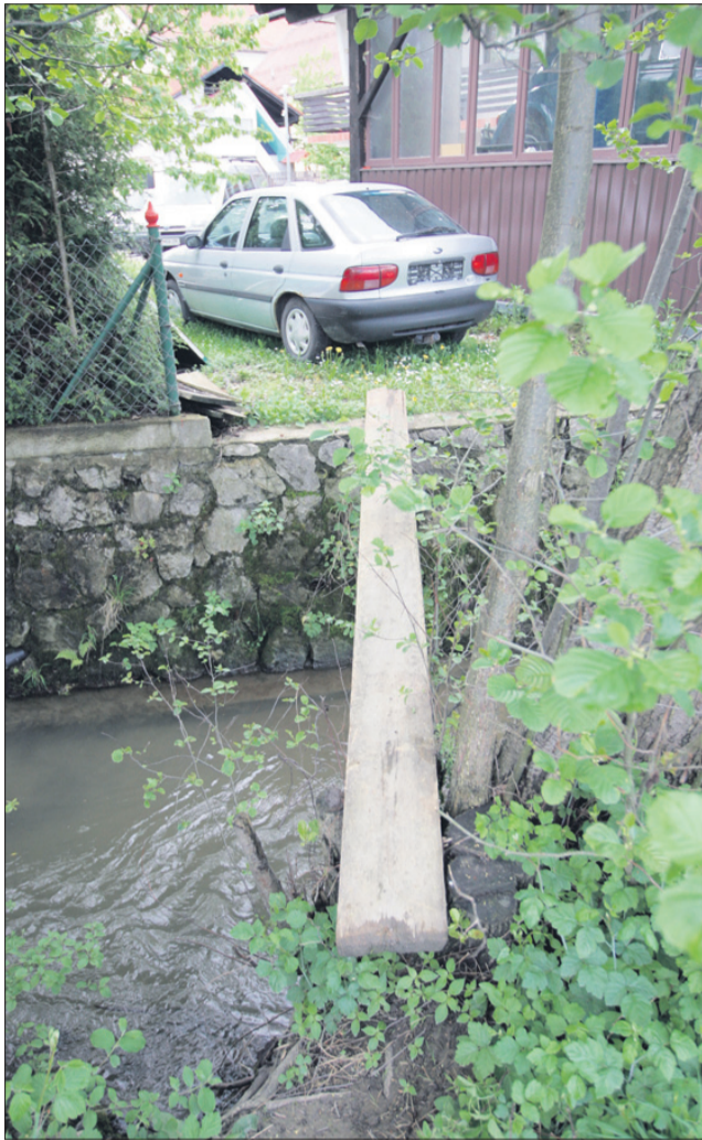
Na drugo stran je nekako treba priti. Pot olajša deska.