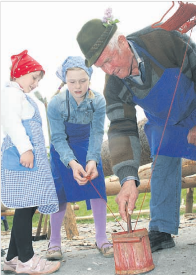
Ta barva je tudi povsem domača. V Železnu pri Galiciji so namreč včasih kopali rudo. Zaradi izrazite rdeče barve so domačini rekli, da kopljejo barvo. Pa še res se obnese tudi kot barva.