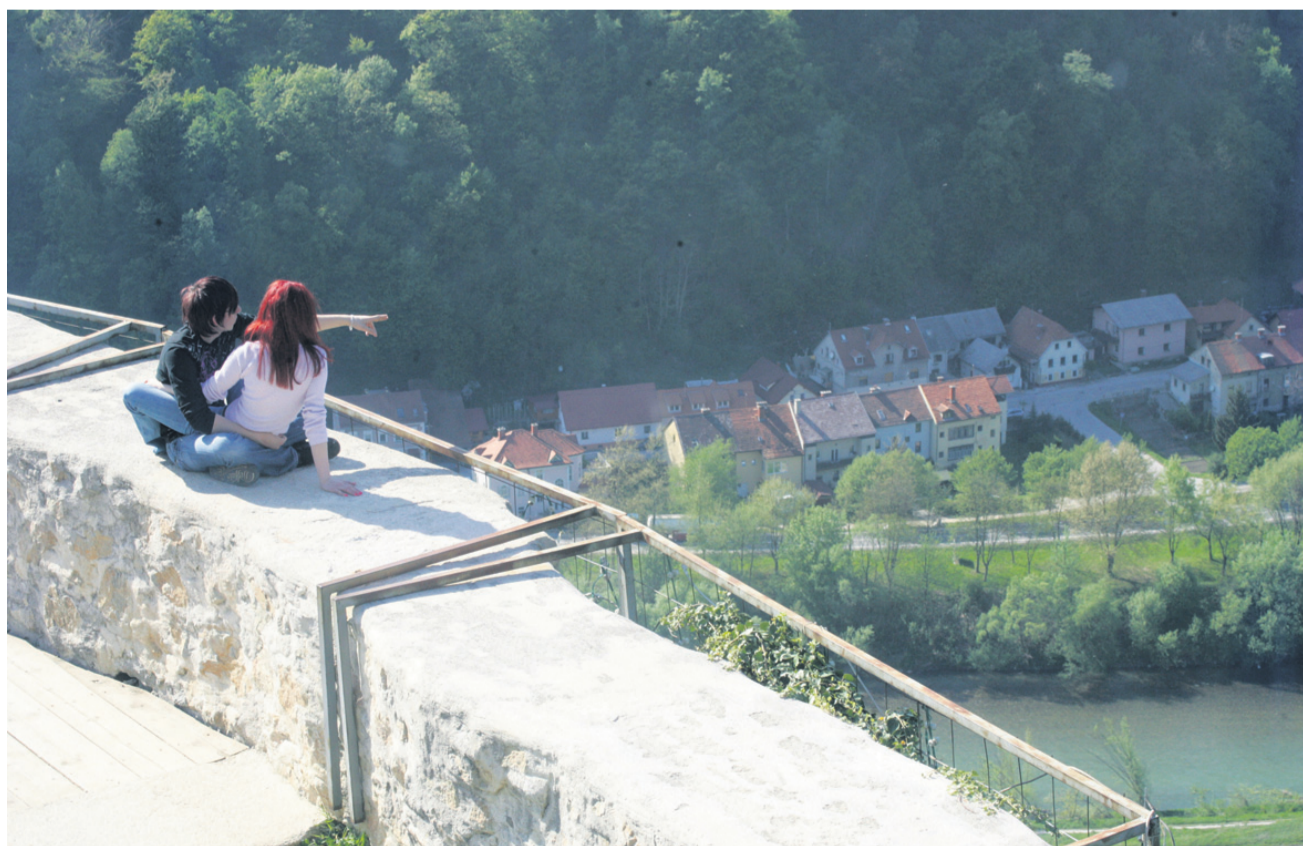
Prišel je maj...