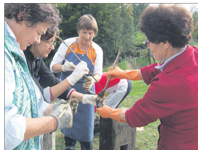
Poljenje rogov za preparat gnoj iz roga v Rogaški Slatini