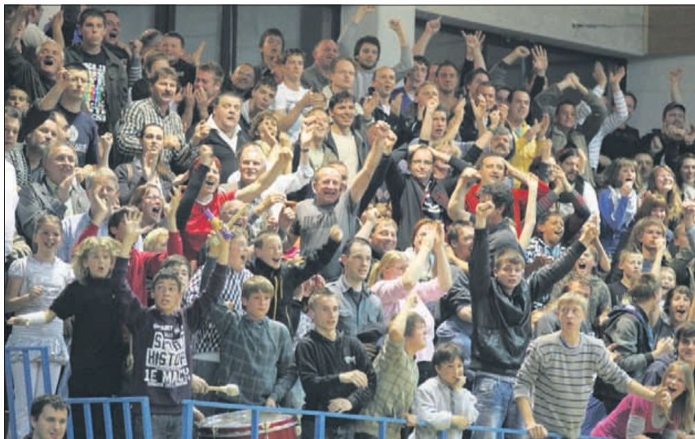
Hruševac je pokal po šivih...

Trenutno četrtouvrščena ekipa se pripravlja na jutrišnjo tekmo z Olimpijo. Gostitelji so sicer favoriti, a Šentjurčani bodo šli na gostovanje neobremenjeni z rezultatom. »Olimpija ima svoje težave, mi pa svoje kvalitete, zato bomo seveda igrali na zmago. Težko bo presenetiti, vendar dokler tekma ne bo končana, se ne bomo predali. Dali bomo vse od sebe, domačini pa se bodo želeli maščevati