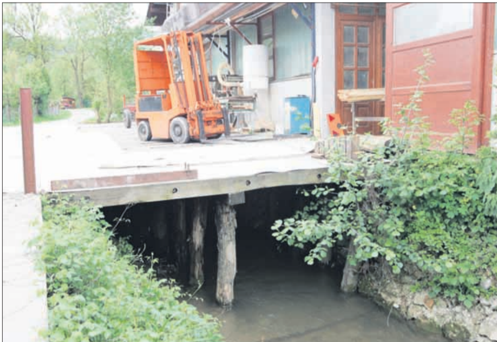
Le malo stran od občinske ceste se v visoki travi »skrivajo« mostovi, celo dovozne poti, brvi ali kar deske za prehod čez potok. Domačini se pač znajdejo po svoje ... Občina ne more posredovati, država pa ne vidi.

A takšni nezakonito postavljeni mostovi in brvi, ponekod celo dovozne poti čez potok, obstajajo in zanje ve tudi župan, vendar sankcioniranje njihovih lastnikov ni v njegovi pristojnosti, saj so na zasebnih zemljiščih in je zanje pristojen vodni inšpektor. »Za to morajo biti odgovorne država in njene inšpekcijske službe,« pravi. Občinski redar nima pristojnosti za posredovanje, saj je odgovoren za ceste, kanalizacijo in promet, ne pa za vode,« pravi. »Kaj je na zasebni zemlji, ne vem niti me ne sme zanimati. Lahko pa občani takšne nezakonitosti prijavijo inšpekciji,« še dodaja. Nekateri ob tem županu očitajo dvojno moralo glede zagotavljanja poplavne varnosti, saj je prav on