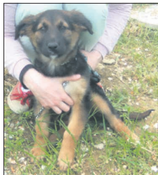
Sestrica moja, tebe nosijo po rokah, mene pa objemajo. Ko bi se nama tako godilo tudi v novem domu.