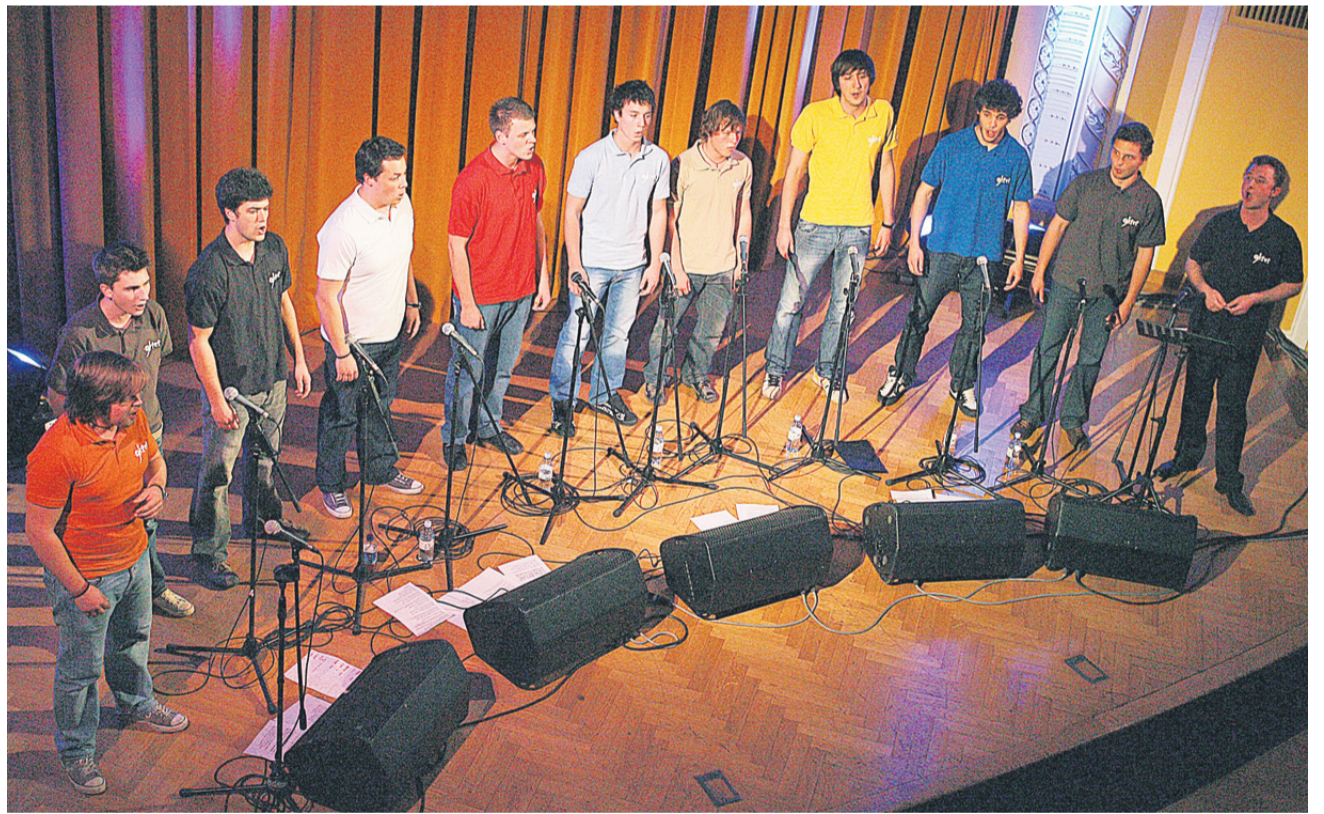
Oktet 9 je na koncertu navdušil občinstvo, v oddaji Slovenija ima talent pa obstal v polfinalu.