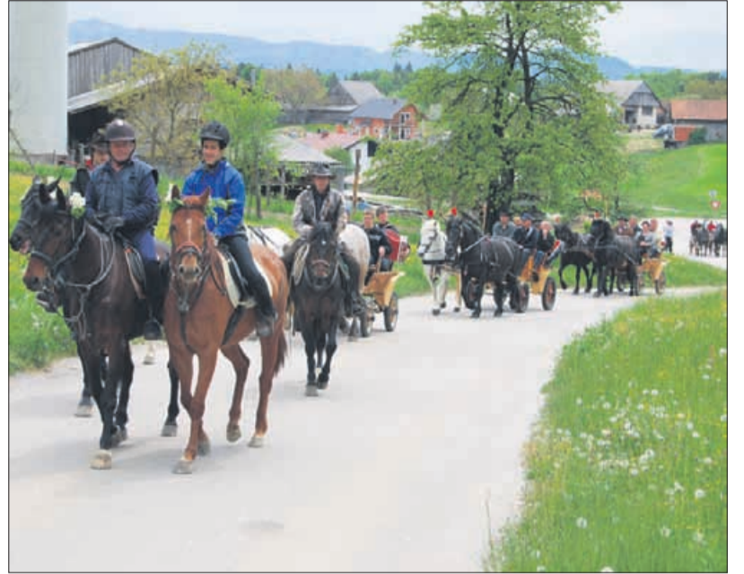
Gališki dnevi so se začeli z Jurjevo konjenico.