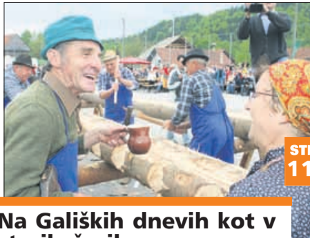
Na Galiških dnevih kot v starih časih