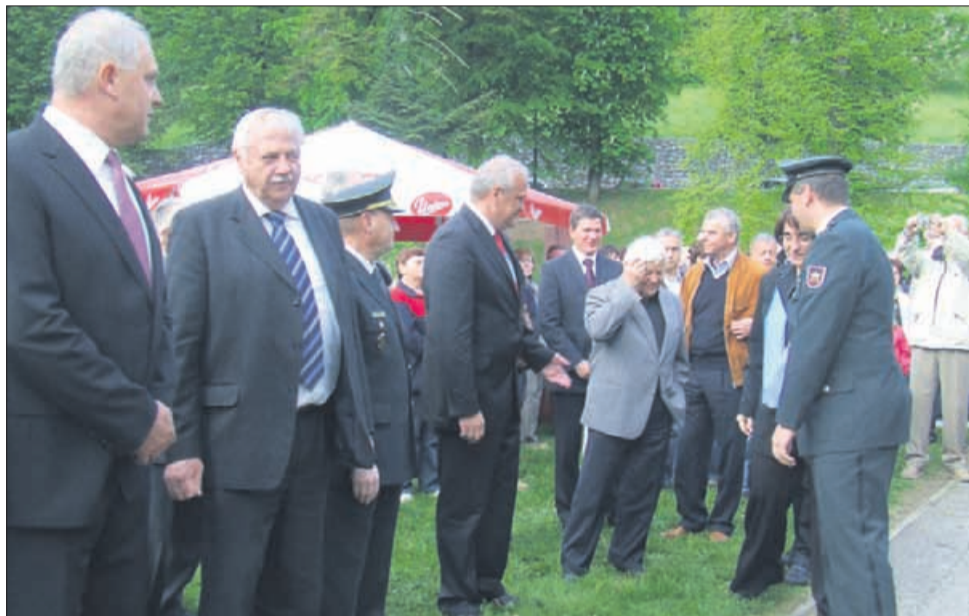
Med številnimi gosti je bil največ pozdrav deležen Milan Kučan.