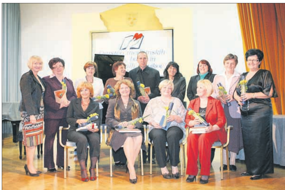
Prejemniki priznanj in zahval na torkovi slovesnosti ob mednarodnem dnevu medicinskih sester v Celju