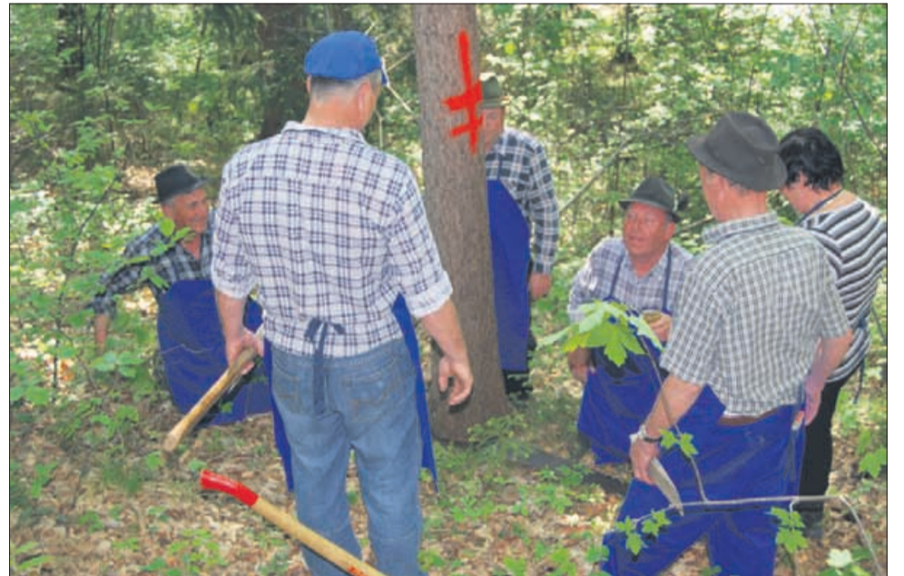
Kje se ga boste lotili?

V okviru Galiških dnevov bodo še posebej zanimivi mladinsko gasilsko tekmovanje, srečanje »štirjakov«, razstava ročnih del in letos še odprtje sirarne, apartmajev in wellnessa na kmetiji Podpečan (Grabnšek).