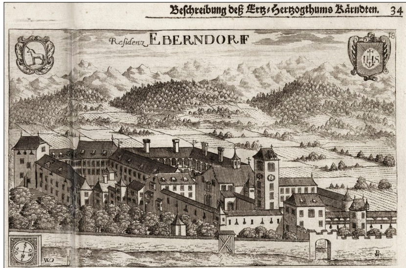
3. Dobrla vas/Eberndorf, samostanski kompleks s cerkvijo Marije Vnebovzete