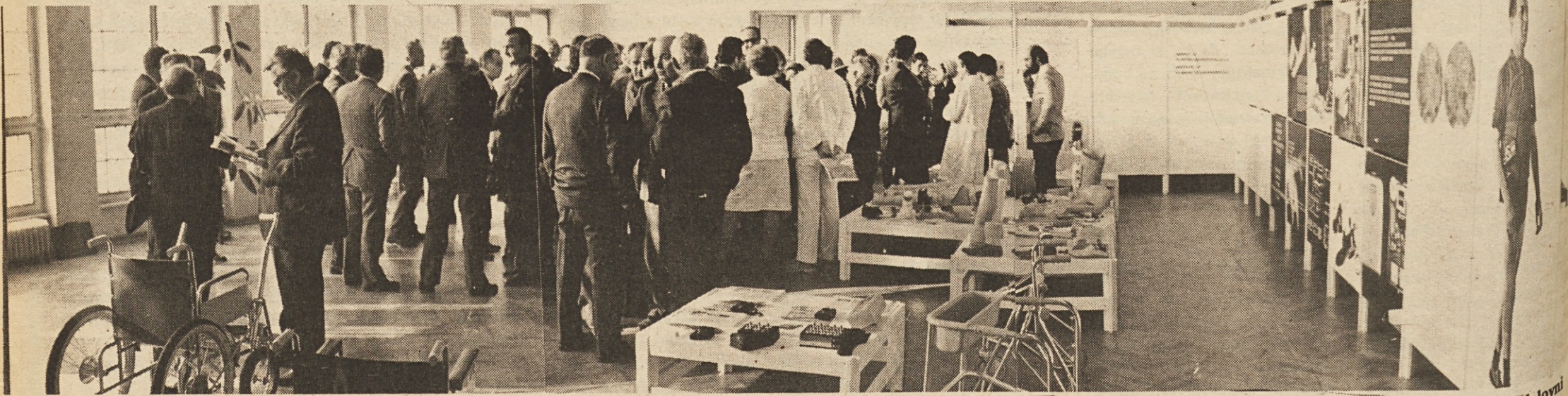
Ob zasedanju obeh zveznih komitejev so pripravili v Zavodu za rehabilitacijo invalidov v Ljubljani nazorno razstavo vseh protetičnih in ortotičnih pripomočkov za invalide, ki jih izdelujejo v delovni enoti zavoda na podlagi izsledkov sedmih znanstvenih institucij združenih v REC.