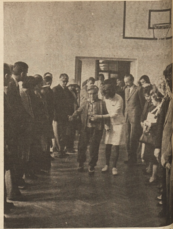
Na razstavi so zbranim članom obeh komitejev in novinarjem demonstrirali delovanje elektronskih stimulatorjev na posameznih pacientih