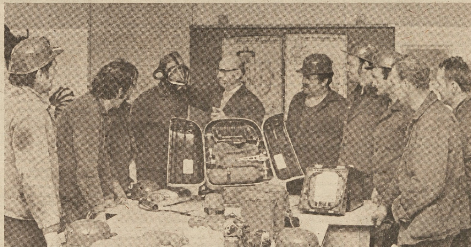
Tečaj za varnost pri delu v idrijskem rudniku

Odgovori anketiranih organizacij na vprašanje o normativni uredenosti izobraževanja potrjujejo omenjeno tezo, da je izobraževanje normativno parcialno in pomanjkljivo urejeno in da ga torej še ne obravnavamo enakopravno z drugimi področji dela v organizacijah združenega dela.