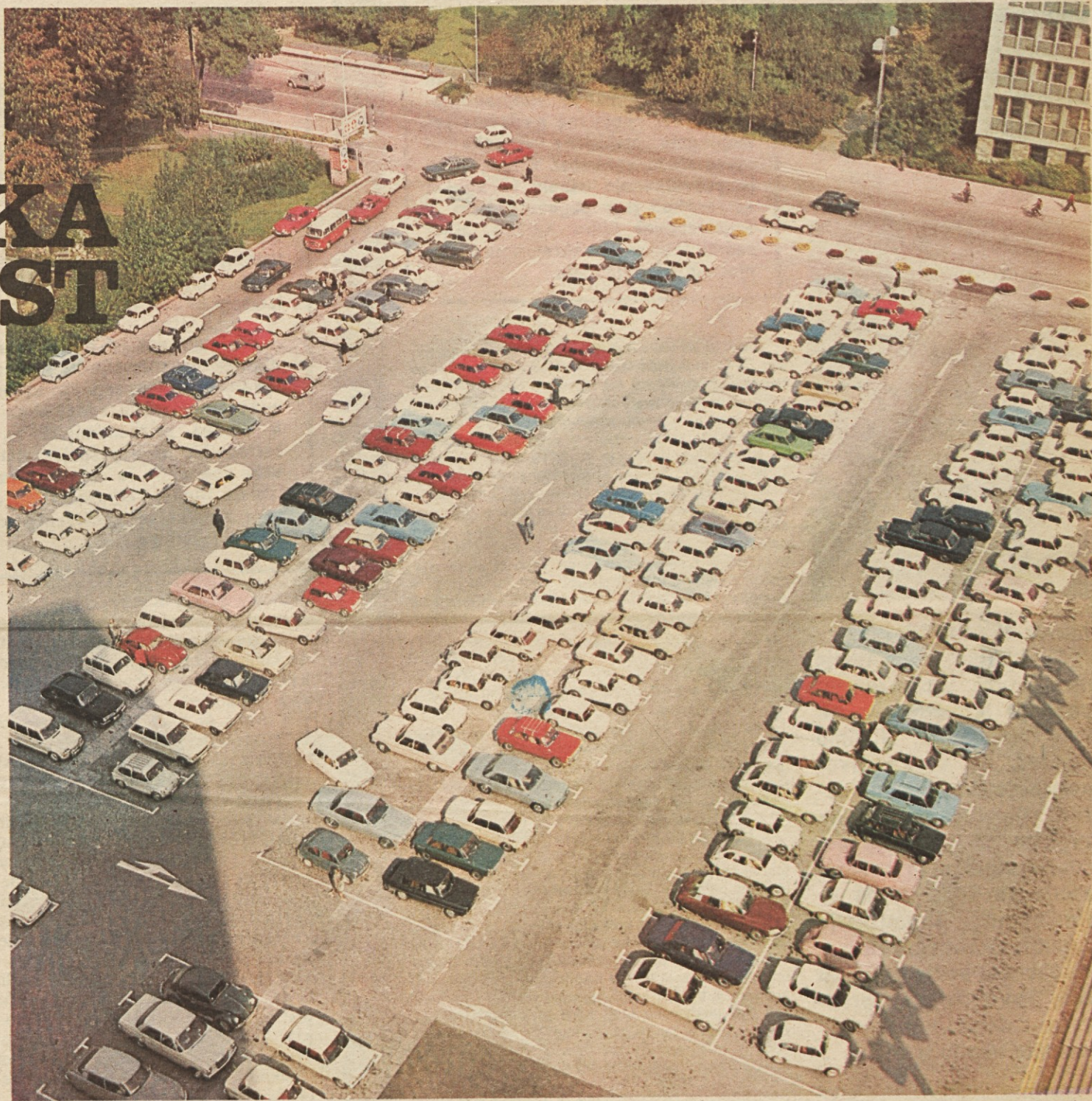
Mar nas bodo avtomobili, ki so sicer sestavni del standarda, izrinili iz mesta?!