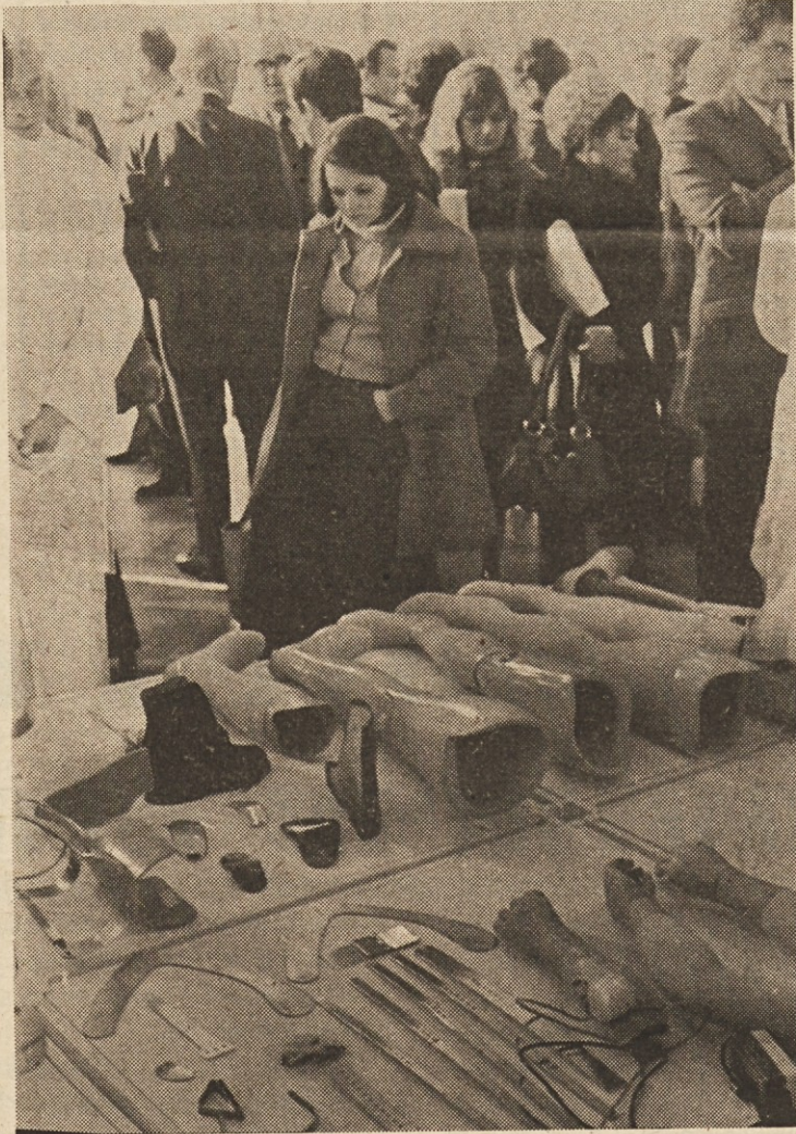
Med izdelki zavoda so bile razstavljene tudi estetsko in funkcionalno narejene zgornje in spodnje okončine za invalide.