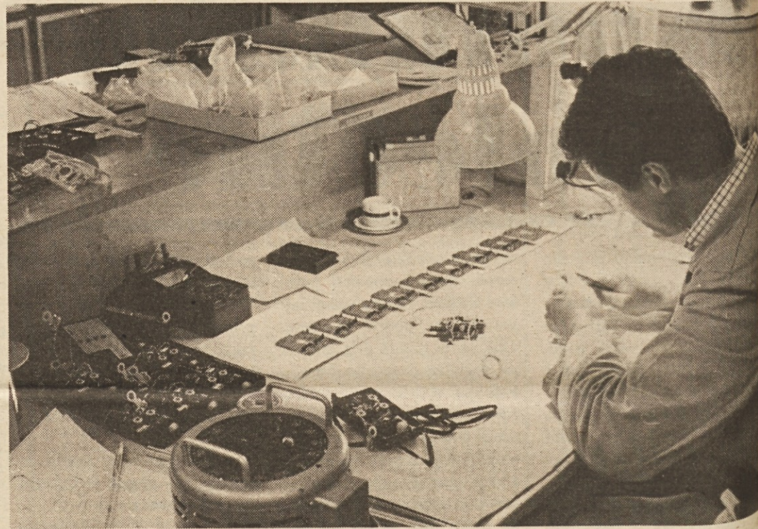
Za serijsko proizvodnjo elektronskih stimulatorjev je potrebno veliko priprav in raziskav. Ko „prototip“ brezhibno deluje in ga tudi medicinsko potrdijo, gre v serijsko proizvodnjo. Elektronski stimulatorji, ki jih delajo v Zavodu za rehabilitacijo invalidov v Ljubljani, so po kvaliteti na svetovni ravni tovrstne proizvodnje

tri programske delovne enote, in sicer v enoto medicinske in profesionalne rehabilitacije, enoto protetike, ortotike in opreme ter enoto znanstveno-raziskovalnega dela. Skupaj je v zavodu zaposlenih 344 delavcev, samo v enoti protetike, ortotike in opreme pa je zaposlenih 161 delavcev. Glavni proizvodi te enote so predvsem ortopedski pripomočki in oprema, kjer je glavni proizvod invalidski voziček v različnih izvedbah, specialne bolniške postelje in ostala transportna sredstva za invalide.