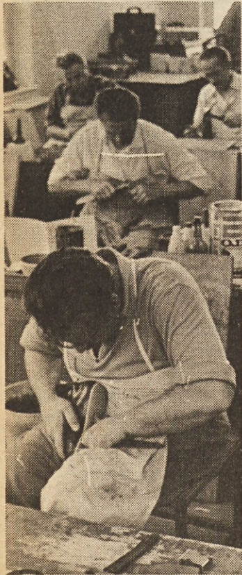
V čevljarški delavnici zavoda ni serijske proizvodnje. Ortopedske čevlje izdelujejo le po naročilu in izdelki so prilagojeni potrebi posameznega invalida.

Invalidom, tako vojnim kot delovnim, moramo zagotoviti enakopraven položaj v vsej državi. Možnost rehabilitacije in pot do sodobnih protetičnih in ortotičnih pripomočkov danes ni za vse enaka, za tiste iz Slovenije in tiste iz Črne gore. Kako najti pot do enakopravnosti, ki je tudi invalidom po ustavi zagotovljena? O tem sta na skupni seji v začetku preteklega tedna v Ljubljani in na Bledu razpravljala zvezni komite za zdravstvo in socialno politiko ter komite za vprašanje