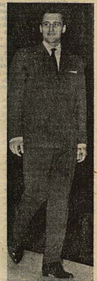
Manekeni so tudi tokrat prikazali vrsto odličnih NOVO-TEKSOVIH kamarnov za moške obleke na Sejmu mode 1962