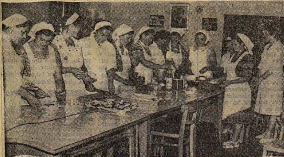
Lani je okrajni zavod za napredek gospodinjstva organiziral vrsto strokovnih tečajev za dokvalifikacijo delavk v gospodinskih poklicih. Na sliki: tečaj kuharic šolskih kuhinj, ki je dal mnogim ženam in dekletom znanje in prvo stopnjo strokovne izobrazbe za poklic »kuhar mlečne kuhinje«. — O nalogah novega Zavoda za napredek gostinstva in gospodinjstva berite na 11. strani današnje številke.

9. januarja so se zbrali na posvetovanje predsedniki in sekretarji občinskih odborov SZDL. Pogovorili so se o organizacijskih vprašanjih in o delu občinskih odborov SZDL. Naloge, ki čakajo Socialistično zvezo glede razlage in sprejema načel nove ustave in izdelovanja občinskih statuten, bodo terjale vsklajeno delo Socialistične zveze v okraju.