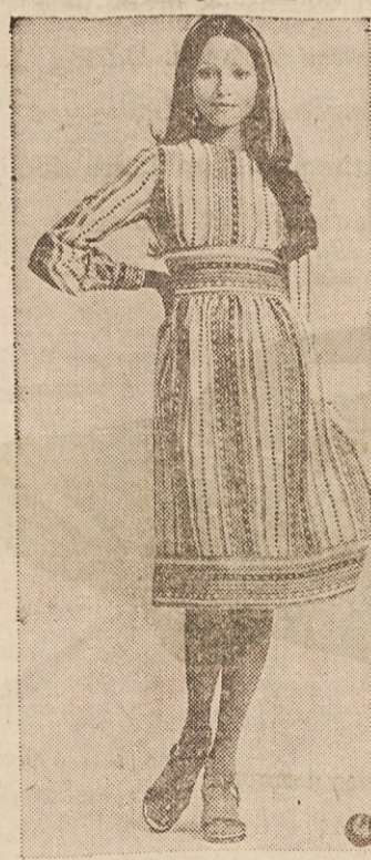
STRIPE APPEAL — Navy and white cotton stripes point up new directions for the summer dress. Used on the horizontal, they focus attention at the waistline and hem. On the vertical, they emphasize the full shirt sleeves and softly gathered skirt of the Carlye design.