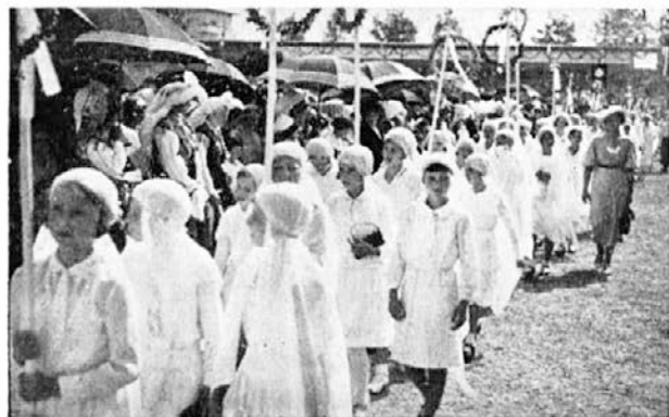
Sestrice sv. Klare 30. julija 1933 na Stadionu.

»Osel hudobni! Žival neumna, trmasta! Ti bom že pokazala! Na, le pokusi mojo gorjačo!«