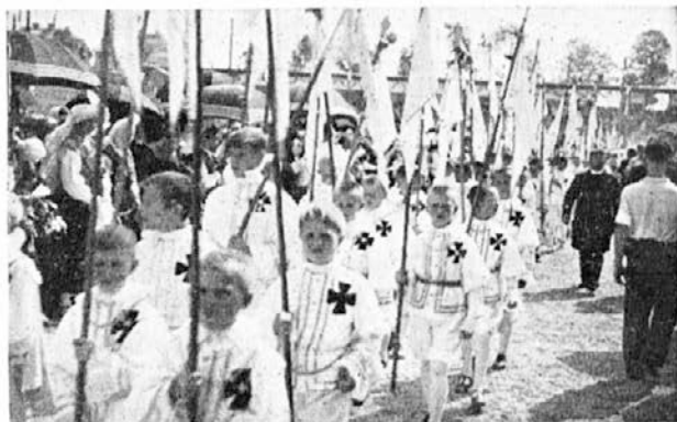
Franciškovski križarji 30. julija 1933 na Stadionu.

jala, sem rajši kar molčal, samo oblizoval sem se in ji kazal hrbet. A nato je zgrabila gorjačo in me začela tako kruto pretepati, da mi je nazadnje zmanjkalo potrpljenja in sem jo trikrat brenil: prva brca ji je razčesnila nos in izbila dva zoba, druga ji je priletela v pest, tretja pa jo je zadela v trebuh in jo prekucnila po tleh. Kakih dvajset ljudi je planilo po meni in so me bili in zmerjali. Gospodinjo so ne vem kam odnesli, mene pa so pustili privezanega h kolu, kjer je bila še vedno zelenjava, ki sem jo prinesel na trg. Čakal sem precej dolgo. Ko sem pa videl, da se zame nihče več ne zmeni, sem pojedel še eno košaro izborne zelenjave, z zobmi pregriznil uzdo in se lepo počasi napotil proti domu. (Dalje prihodnjič.)