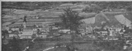
Trebnje — Jožkov rojstni kraj.