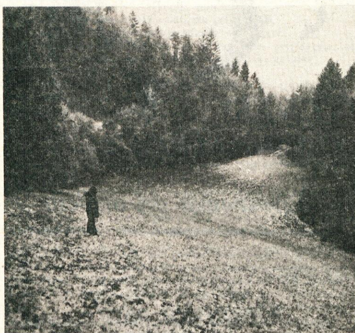
Sedanji videz ledine Drage, mesta Dežmanovega raziskovanja julija 1878.

Zima se je vtekla v nedogled in šele maja 1878 se je zemlja toliko osušila, da je bilo mogoče resneje misliti na prva raziskovanja, resnično prva v zgodovini slovenske prazgodovinske arheologije oziroma najdišč. Dežman je prvo znanstveno kopanje na Vačah, dejansko v okolici Klenika, izvedel uspešno in na nivoju arheološke znanosti druge polovice 19. stoletja, sicer ob budnem spremljanju izkopov in pobiranju najdb in tudi organskih ostalin, manj pedantno glede dokumentiranja plasti, najdenih ostalin na kraju samem in zlasti natančnega mesta kopanja. Vemo, da je Dežman, ob pomoči