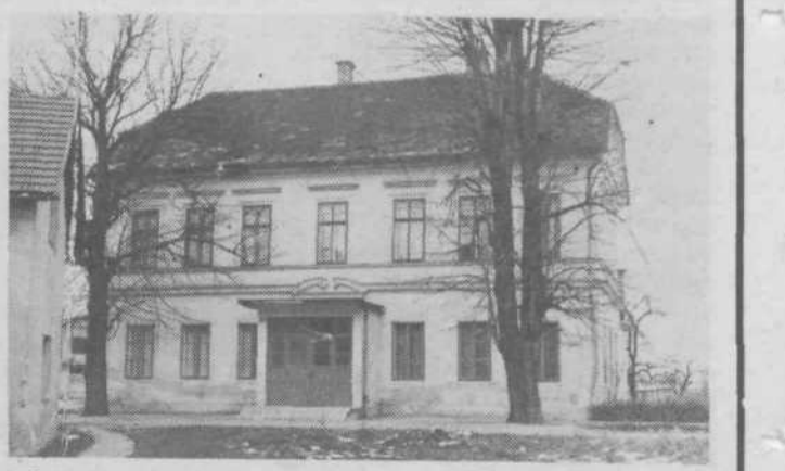
OŠ Hrušica praznuje visok jubilej – 90. obletnico delovanja. Slavnostna proslava bo v soboto 23. novembra ob 16. uri v kultnem domu poleg šole. Po proslavi bo odprta v šolskem poslopju razstava dokumentov in predmetov borcev NOV in internancencev z območja KS Hrušica – Fužine in Bizovik – nekdanjih učencev OŠ Hrušica.