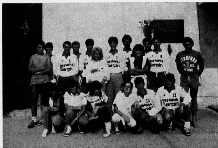
Odbojkarji in odbojkarice Olymple na pripravah v Gornji Radgoni, o čemer je naš list že objavil poročilo