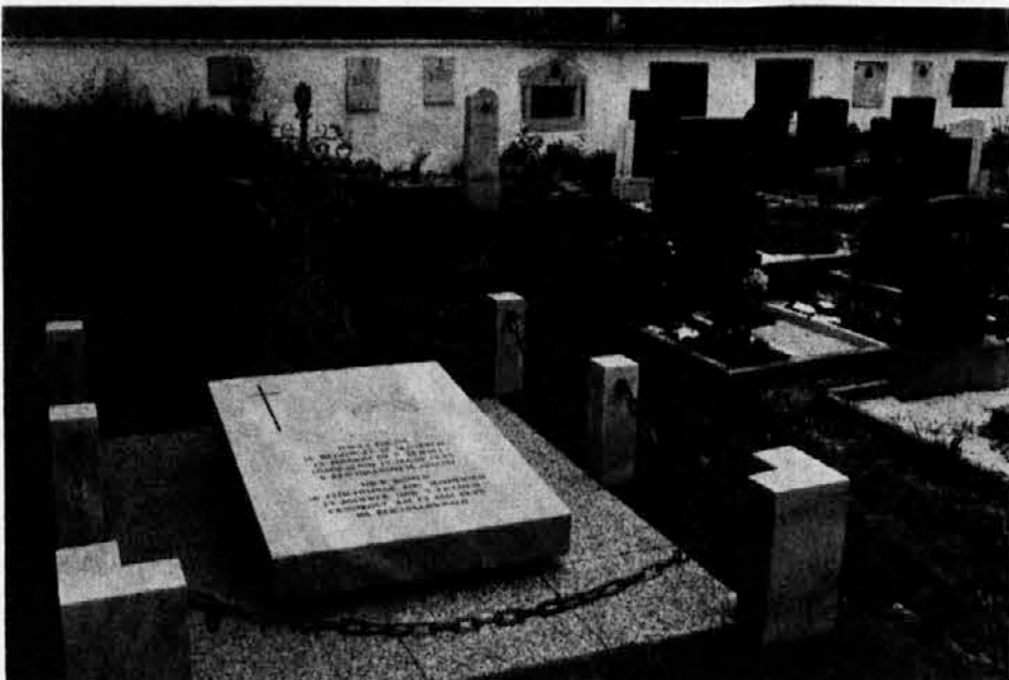
Skupni grob 16 beguncev v Glinjah ob Dravi, ki so jih pomorili slovenski partizani 13. maja 1945

Verjetno je tudi to vplivalo na vlado v Varšavi, da je res izpustila vse politične jetnike iz zaporov; gre v glavnem za člane sindikata Solidarnost. S tem je Jaruzelski napravil gesto pomirjenja doma in tudi pred zunanjim svetom. Saj se že govori, da bo uradno obiskal Italijo. S tem je bil napravljen tudi velik korak, ki naj pripravi pot tretjemu obisku Poljske papeža Janeza Pavla II., ki bi moral biti prihodnje leto.