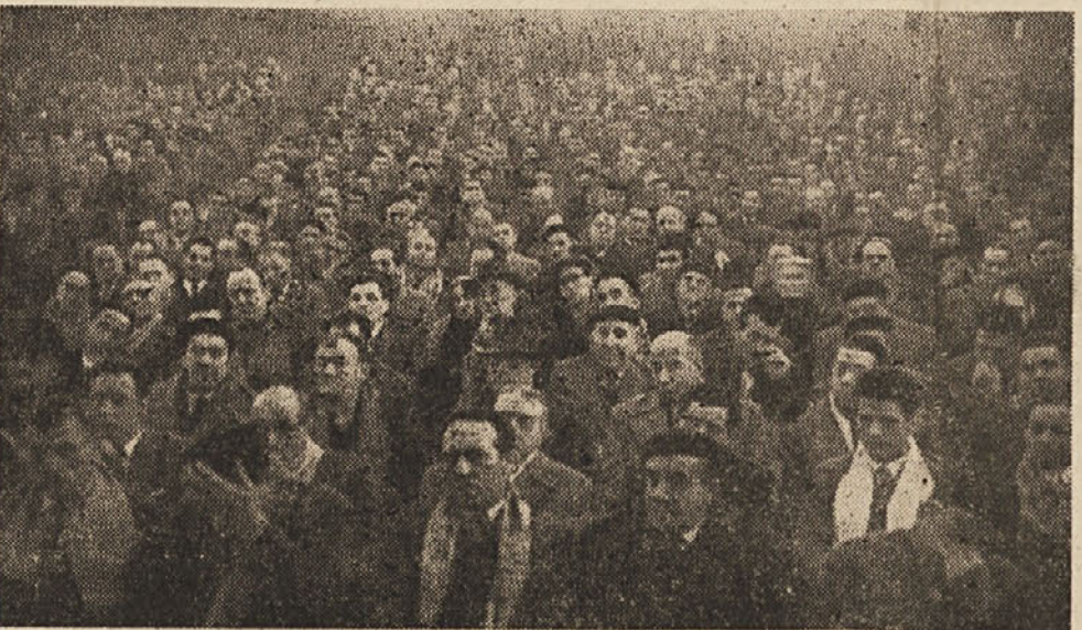
Pogled na del kinodvorane «Arcobaleno», kjer je bilo v nedeljo zjutraj enotno zborovanje kovinarjev CRDA in Arzenala

Dejansko ni prišlo v prvih dveh dneh (sredo in četrtek) ni prej resilo. Sindikalisti so iznesli predlog, naj bi tudi za CRDA veljal načelni sporazum, ki je bil že dosežen kar se tiče doklade za zdravju škodljiva dela v Tržaškem arzenalu. Popoldne so predložili te zahteve pisмено. Nato so načeli vprašanje akordnega dela in delavcev, ki delajo na odstotke. Predstavniki CRDA pa so za-