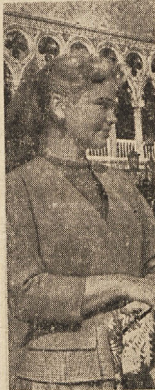
Sovjetski uspehi na znanstvenem in tehničnem področju so dokazali vsemu svetu, da razpolaga Sovjetska zveza...