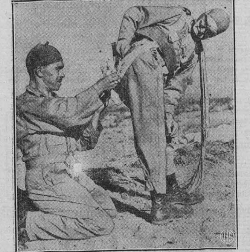
Na sliki vidimo našega parašutarja, ki se je spustil z padalom na tla, ker ga niso dobili sovražniki pa ga je dobil kaktus in mu pustil par svojih bodic tam "na drugem koncu telesa."

ževi bataljoni pa vstajajo iz raz- ... valin in pogorišč naših domov. ... "Oddelki naše garde so se ... razvijali pod zaščito naših pri- ... jateljev in zaveznikov, v okri- ... lju Velike Britanije, ki jih je ... vzela za svoje in z njimi v vseh ... ozirih ravna kakor s svojimi ... lastnimi ljudmi. Draževi bata- ... ljoni pa so se zbirali v težkih ... borbah s sovražnikom, in sicer ... ne samo z enim samim sovraž- ... nikom, in obkoljeni od vseh str- ... ni. ... "A vedar so naši oddelki in ... Draževi bataljoni enaki v svoji ... ljubezni do naroda. Nerazdru- ... žno jih veže geslo, ki je vplete- ... no v vašo zastavo: z vero v Boga, ... za kralja in domovino. ... "Vaši oddelki zdaj ponosno ... vstopajo v sestavo armade ge- ... nerala Draže Mihajlovića. Na ... tem potu junaške borbe vas po- ... zdravljam, častnike, podčastnike ... in moštvo, da bi čimprej prispe- ... li do našega cilja, do osvobodit- ... ve in obnove Jugoslavije!"