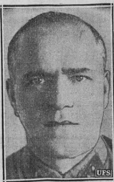
Na fronti v okrožju Moskve poveljuje ruski general Gregory Zhukoff, ki nam ga predstavlja gornja slika.