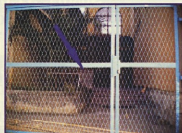
67 Zakrit vodnjak na dvorišču Mehana, Polje št. 9

Vodnjak št. 66 je v ograjenem dvorišču stare železniške postaje. drugi vodnjak (št. 67) pa se skriva za ograjo tovarne Mehanotehnika in je po pripovedovanju nekdanjih delavcev vsekakor vreden zabeležke.