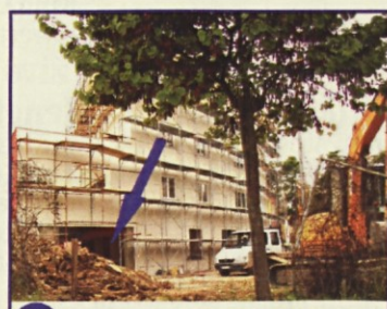
68 Prekrit vodnjak v notranjosti "vile" v Drevoredu 1. maja

Vodnjak na parkirišču starega zdravstvenega doma so ob gradnji stavbe menda zaščitili, vendar bo treba podatek še preveriti.