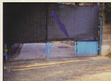
66 Zakrit vodnjak na dvorišču nekdanje železniške postaje v Kraški ulici št. 1

Naša akcija "vodnjaki" je prišla nekako do polovice. Zdaj smo sredi razvrščanja in opisovanja vseh doslej predstavljenih vodnjakov, ki jih bomo predvidoma predstavili na večji mapi v naslednji številki, do takrat pa dajemo v vednost še tri vodnjake do katerih pa je dostop nekoliko oviran. Namreč, tudi mi si ne upamo čez ograje ali v tuje hiše, vemo pa, da so vodnjaki tam.