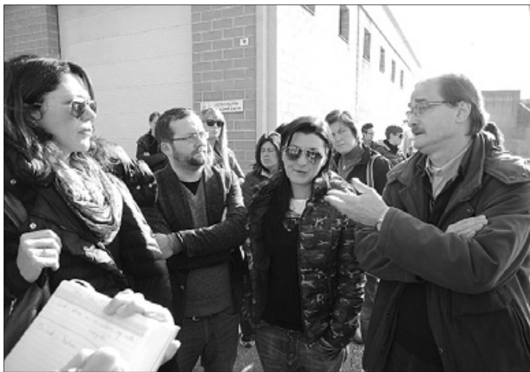
Včerajšnje srečanje med delavci in sindikalisti

Družba Sweet, ki jo je ustanovil goriški podjetnik Fabrizio Manganelli, je bila v preteklosti med najpomembnejšimi svetovnimi proizvajalci čokoladnih jajčk, nato pa je zašla v težave, ki so bile povezane predvsem s prekinitvijo sodelovanja z družbo Dolci Preziosi. V letih 2003-2005, ko je bila v polnem razcvetu, je družba proizvajala 70 milijonov čokoladnih jajčk letno, v letih 2010-2011 pa je proizvodnja upadla na 45 milijonov. Do 22. maja lani se je nabralo preko 19 milijonov evrov dolga, konec julija pa je bil razglašen stečaj. (Ale)