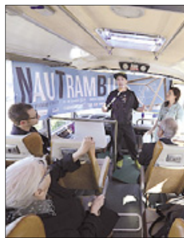
Na avtobusu doživeti...