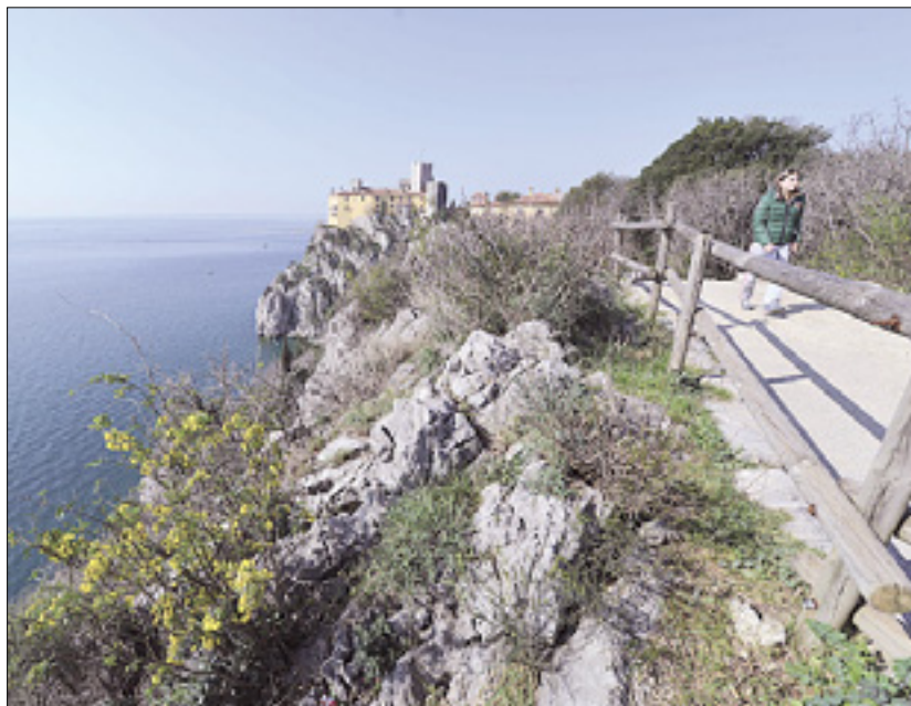
Pogled na Rilkejevo pešpot

Antonijevi predlogi gredo v smer trajnostnega razvoja območja, ki bo omogočila naravi prijazne turistične usluge. Tako je predvidena namestitve nevpadljivih železnih ograj na pešpoti, ureditev štirih gledišč, in predvsem ureditev info točke na območju pri Kupčevih ob devinskem vходу na Rilkejevo pešpot (med obstoječim kamnitim zidom, mejo naravnega rezervata, in cesto.