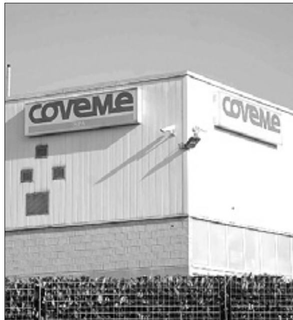
Coveme (levo); Codena (spodaj)

Tovarna Codena je prenehala delovati avgusta - Mobilnost tudi za 12 uslužbencev podjetja Coveme