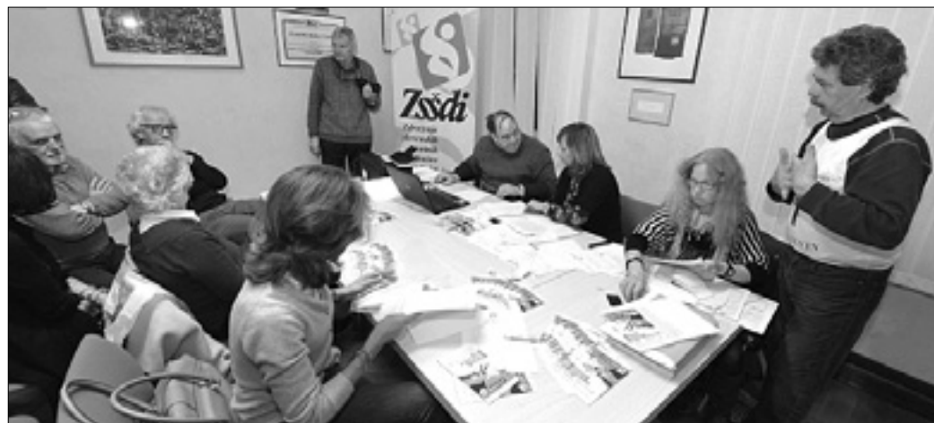
Žrebanje je bilo na tržaškem sedežu ZŠSDI

Skupno bo na prvenstvu v alpskem smučanju na progah B in D nastopilo v nedeljo 234 tekmovalcev, kar je sicer razmeroma malo, toda v skladu s pričakovanji. Največ tekmovalcev je prijavil Cai 30. oktobra (78), sledijo Sci Club 70 (74), Devin (25), Mladina (239; DLF 20, Brdina (8) in univerzitetni SAI Trieste (2). Štiri prijavljena Tržačana ima tudi trbiški Monte Lussari, enega pa klub Fornese.