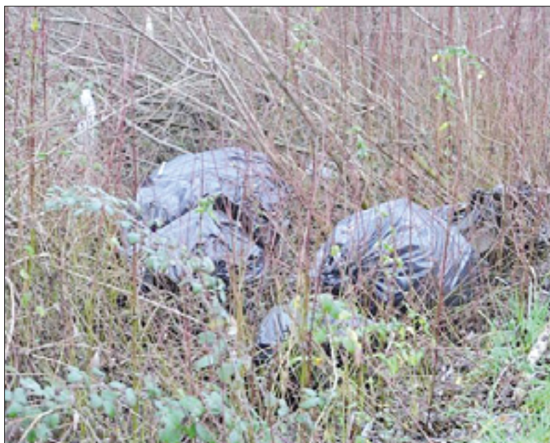
Vreče odpadkov med grmi

V prejšnjih letih so v doberdobski občini priredili že več čistilnih akcij, vsakič so nabrali cel kup odpadkov in odkrili tudi več divjih odlagališč sredi kraške gmajne. Pred dvema letoma so z nabranimi odpadki napolnili dvajset tovrstnih odpadkov, odkrili so tudi nekaj odlagališč azbestnega materiala. S podobnimi težavami se ukvarjajo tudi Tržiču in Ronkah, kjer je po kraških predelih obeh občine cel kup divjih odlagališč.