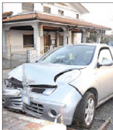
Avto peljejo s kraja nesreče

Na pokrajinski cesti št. 15 v doberdobski občini se je včeraj popoldne zgodila prometna nesreča, v kateri je bil ranjen 30-letni voznik. Moški se je z avtomobilom zaletel v drevo ob cesti, po prvih informacijah pa naj bi njegovo zdravstveno stanje ne vzbujalo skrbi. Nesreča se je zgodila okrog 17. ure med Poljanami in tovarno pri Doberdobu. Voznik se je z osebnim avtomobilom znamke Nissan micra peljal po pokrajinski cesti, v še nepojasnjenih okoliščinah pa je izgubil nadzor nad vozilom, zapeljal s ceste in čelno trčil v drevo. Na prizorišče nesreče so prišli rešilna služba, prometna policija iz Tržiča in gasilci, ki so mladeniču pomagali izstopiti iz avtomobila, saj so bila vrata blokirana. V bližini je pristal tudi helikopter, ki je voznika odpeljal v videmsko bolnišnico. (Ale)