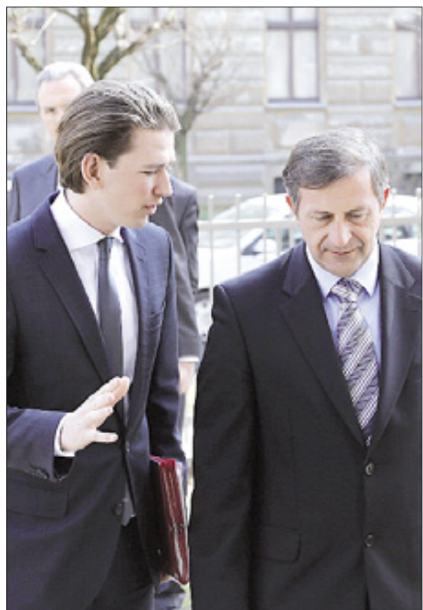
Avstrijski zunanji minister Sebastian Kurz (levo) in njegov slovenski kolega Karl Erjavec (desno) med včerajšnjim srečanjem