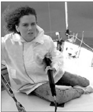
0.00 Film: Ore 10 - calma piatta (i. N. Kidman)

6.10 Mediashopping 6.25 Serija: Chips 7.20 Serija: Miami vice 8.15 Serija: Hunter 9.40 Nan.: Carabinieri 10.40 Sai cosa mangi? 10.50 Ricette all'italiana 11.30 Dnevnik, vremenska napoved in prometne informa- cije 12.00 Nan.: Detective in corsia 12.55 Nan.: La signora in giallo 14.00 Aktualno: Lo sportello di Forum 15.30 Nad.: My Life 15.50 Film: I quattro cavalieri dell'apocalisse 18.55 Dnevnik in vremenska napoved 19.35 Nad.: Il Segreto 20.30 Nad.: Tempesta d'amore 21.15 Aktualno: Quarto grado