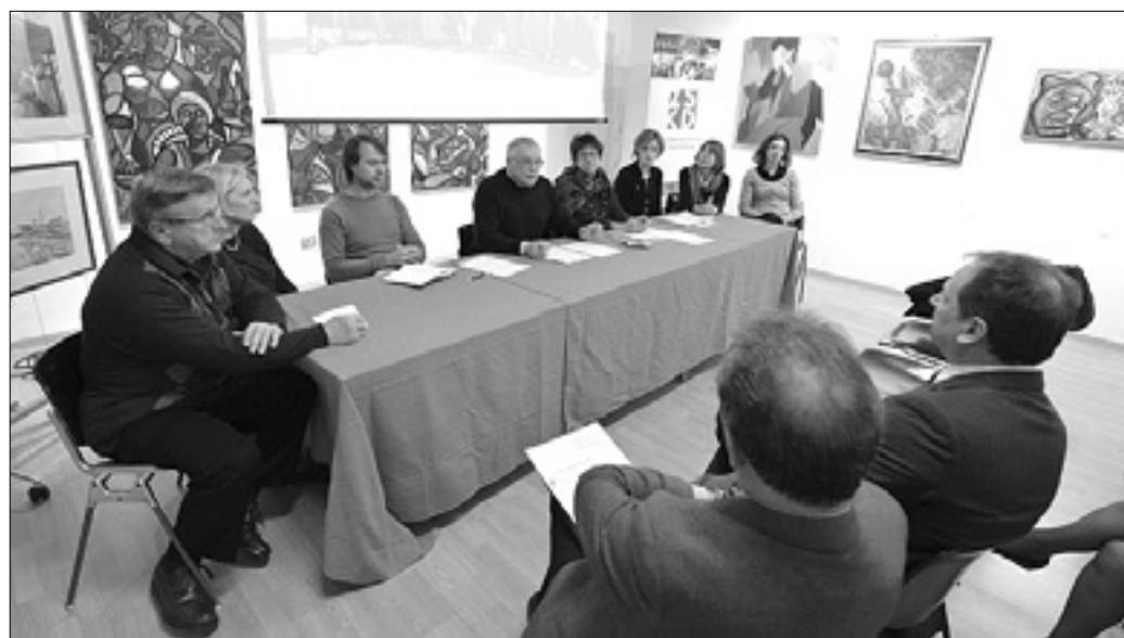
Predsedniško omizje na sinočnjem zasledanju pokrajinskega sveta ZSKD