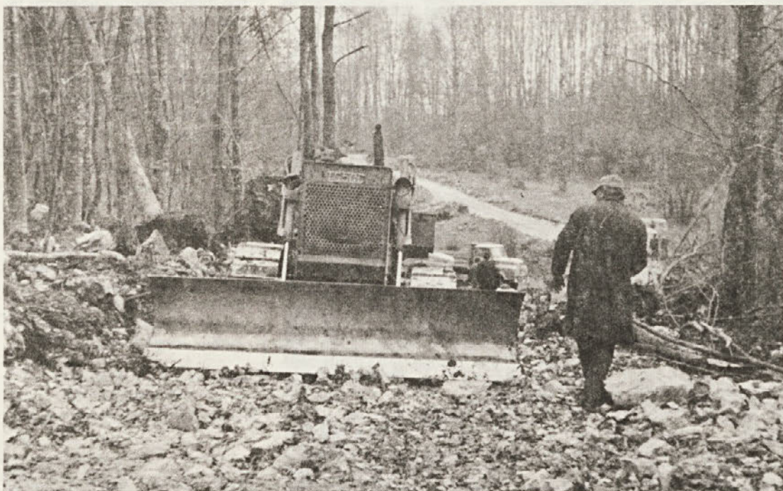
Pred pričetkom redčenja v Žvirskem gozdu je TOK Gozdarstvo Novo mesto zgradil 1300 m gozdne ceste, za kar je porabil okrog 42.000 din. V prihodnjih letih bodo prerediti 120 ha razmeroma lepega bukovega drogovnjaka. Za začetek bodo letos prerediti v sodelovanju s tovarno celuloze in papirja Krško 40 ha in pridobili okrog 1500 m 3 celuloznega lesa. Cesto bodo še podaljšali. Letos bodo opravili zemeljska dela še za 1 km ceste.

Konec aprila 1980 je živel v Sloveniji 1.898.311 prebivalcev, od tega 921.502 oz. 48,5 % moških in 976.809 oz. 51,5 % žensk. V tem mesecu se je število prebivalstva povečalo za 1.122 prebivalcev. Od skupnega števila prebivalcev v SR Sloveniji jih je aprila živel na območju slovenskih mest 809.200 oz. 42,6 % vsega prebivalstva.