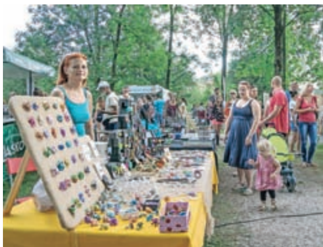
Tudi letos je del festivala sejem, ki nastaja v sodelovanju Diversity – express yourself in KUD KUFR.