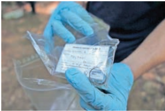
Pri izkopu je bilo tudi nekaj osebnih predmetov, med drugim dve pasni sponki, dva prstana, glavnik, nekaj gumbov, žepni nož ...

Medtem ko je bilo za večino omenjenih ugotovljeno, da so v grobiščih pokopani Črnogorci (ti so že pred leti sporočili, da izkopa skelet ne želijo, saj se svojcev lahko spominjajo v Parku spomina in opomina, ki so ga na Kopiščih uredili pred dvema letoma), se je med Kamničani vrsto let predvidevalo, da so v grobišču Macesnovec svoje življenje sklenili slovenski domobranci. A izkop, ki so ga v Kamniški Bistrici po naroči-