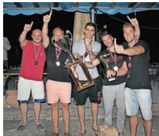
Skupni zmagovalci letošnjega Kvadratlona: ekipa ZZP

Ekipa (letos jih je bilo šest) so se v treh dneh merile v štirih različnih poletnih športih: prvi dan v nogometu na mivki, drugi dan v vaterpolu, tretji dan v košarki 3 x 3 in odbojki na mivki. V desetih letih je bilo na tekmovanju kar nekaj zmagovalcev, le dvema ekipama pa je uspelo osvojiti tudi prehodni pokal, ki ga prejme