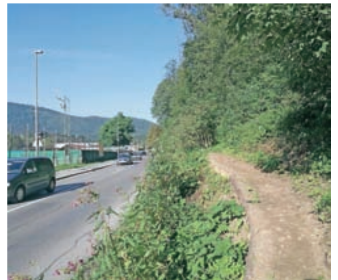
Urejeno izhodišče pešpoti na Stari grad

Akcij je bilo še več, omenimo zgolj še dve. Uredili so del poti na Stari grad s strani Pod skalco. Namestili so 16 metrov bočnih zaščit, očistili zaraščeno pot in jo