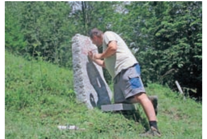
Povsem zbledeli napis na spomeniku v Zakalu je zdaj spet viden.