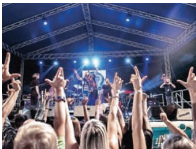
Festival je v znamenju kakovostnih izvajalcev in raznovrstne glasbe.