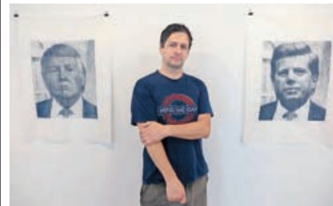
Začne se z aktualnim predsednikom ZDA.