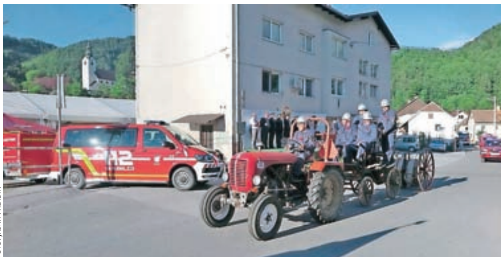
Najstarejše vozilo, ki je še v lasti motniških gasilcev, levo pa novo vozilo GVM-1