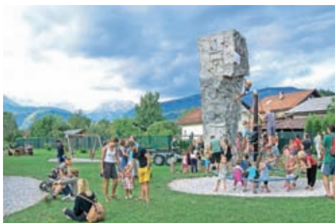
Pestro dogajanje v "Keršmancu" znova dopolnjuje tudi plezalna stena.