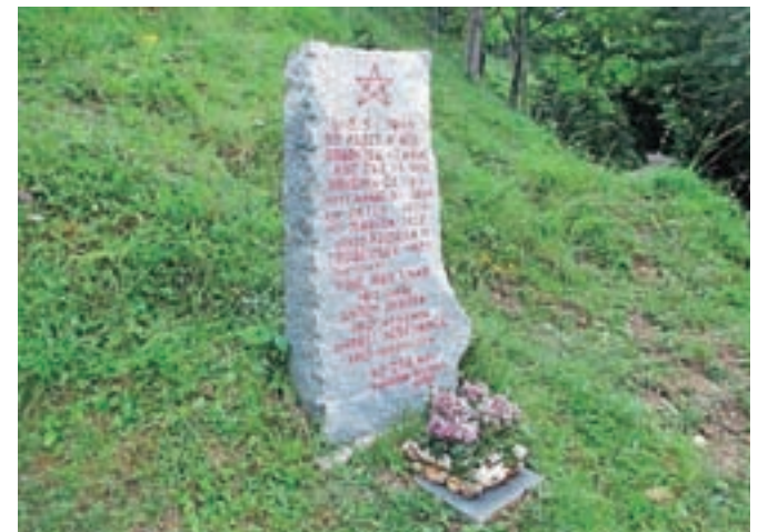
Obnovljeno spominsko obeležje v Zakalu