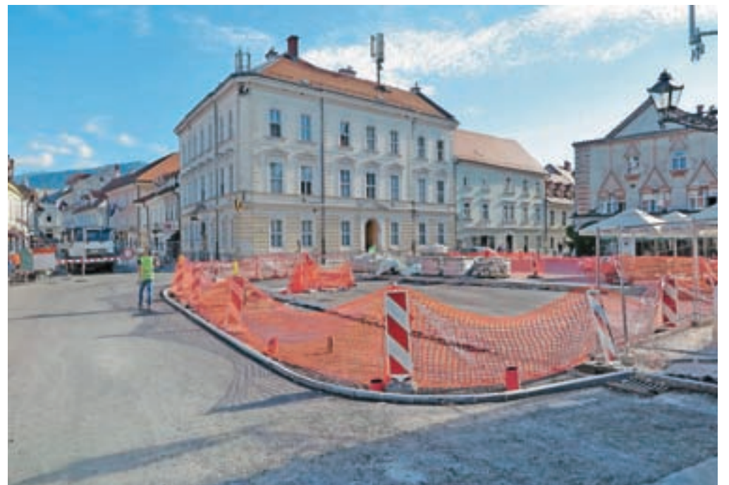
Obnova Glavnega trga se preveša v sklepno fazo.

Potem ko so se na občini sprva soočili s klici nekaterih nezadovoljnih občanov in najemnikov ter lastnikov poslovnih prostorov, do katerih je dostop je zaradi gradnje otežen, zdaj dobivajo vprašanja v zvezi z novo ureditvijo. »Dejstvo je, da smo se prenovne lotili premišljeno in ob upoštevanju zakonodaje, predvsem pa smernic in zahtev Zavoda za varstvo kulturne dediščine Slovenije ter mnenj projektivnega biroja Štajn arhitekti. Oblikovanje Glavnega trga tako sledi ideji, da ta prostor ponovno postane trg – in ne zgolj ulica. Ker trenutno v Kamniku zaradi potreb stanovalcev prometa ni mogoče popolnoma umakniti iz mestnega središča, je cesta čez ta trg nujna. Da pa bi bila ta čim manj opazna in izrazita, so bili izbrani robniki, ki bodo kar se da podobni ploščam