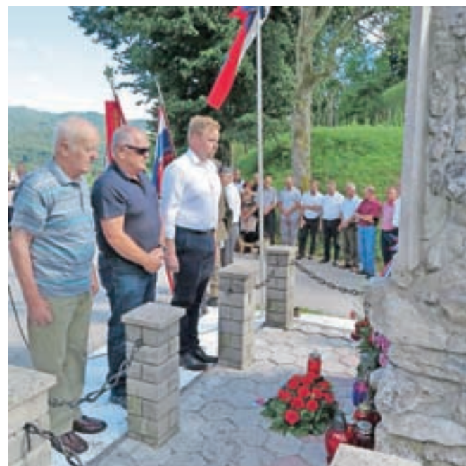
Položitev venca k spomeniku v vasi Gradišče