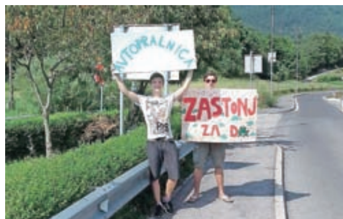
Ustavite se lahko tudi na limonadi in s prostovoljnimi prispevki podprete Rdeče noske.

Animatorji, ki se pripravljajo tudi na nov oratorij, so brezplačno pranje avtomobilov in deljenje limonade izvedli še v petek, 11. avgusta, skupaj z otroki na oratoriju pa bodo akcijo ponovili še v četrtek, 24. avgusta, od 10. do 11. ure. Mesto akcije ostaja enako – prostor ob glavni cesti in Osnovni šoli Šmartno v Tuhinju. Vsi prostovoljni prispevki bodo v celoti šli za Rdeče noske. Vabljeni, da akcijo podprete tudi vi!