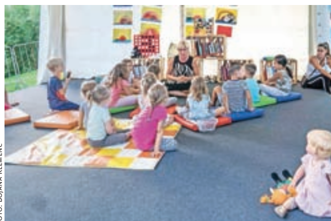
Pravljicne ure Knjižnice Franceta Balantiča Kamnik so namenjene najmlajšim obiskovalcem festivala.