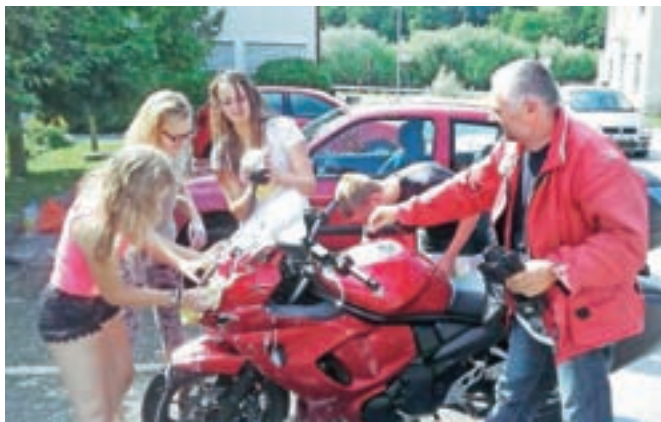
Brezplačno pranje avtomobilov bodo v Šmartnem pripravili tudi v četrtek, 24. avgusta.

Šmartno v Tuhinju – Mladi animatorji oratorija so izvedli posebno akcijo brezplačnega pranja avtomobilov, poleg tega pa vsem, ki so se ustavili ob poti, nudili tudi limonado povsem brezplačno. Mladi so opremljeni z raznobarnimi plakati, osvežilno limonado ter gobami, čistili in vodo ob cesti vabili ljudi, naj se ustavijo, osvežijo z limonado in prepustijo avtomobile čiščenju. Akcija je potekala v popoldanskih urah, v njej pa je bilo udeleženih več kot trideset animatorjev. Ob cesti se jim je v avtopralnici pridružilo nekaj več kot štirideset avtomobilov, motorjev in drugih vozil, razdelili pa so več litrov limonade. Pozitivno energijo in dobro voljo so de-