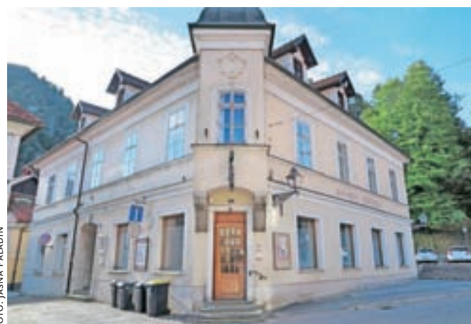
Kavarna Veronika je zaradi potrebne obnove – ta se je v teh dneh vendarle začela – zaprta že od konca lanskega leta.

179.959,05 evra z DDV. Pogodba med naročnikom in izvajalcem instalacijske prenove in sanacije vlage v objektu je bila podpisana 26. julija z rokom izvedbe del tri mesece. V skladu z veljavnimi predpisi je naročnik skupaj z nadzornim organom in izbranim izvajalcem že izvedel postopek uvedbe v delo, kar pomeni, da je izvajalcu bila podana izročitev gradbišča, pravica dostopa na gradbišče, tehnična dokumentacija za izvajanje del, zagotovitev sredstev za financiranje gradnje objekta,« so nam pojasnili na občini. Izvajalec je dela, ki so opredeljena v projektno-tehnični dokumentaciji, začel izvajati v sredo, 9. avgusta.