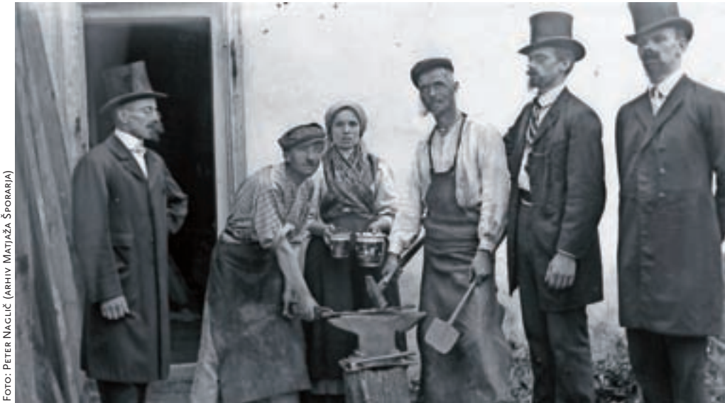
Prizor iz igre Kovačev študent, ki so jo v Šmarci odigrali leta 1910.