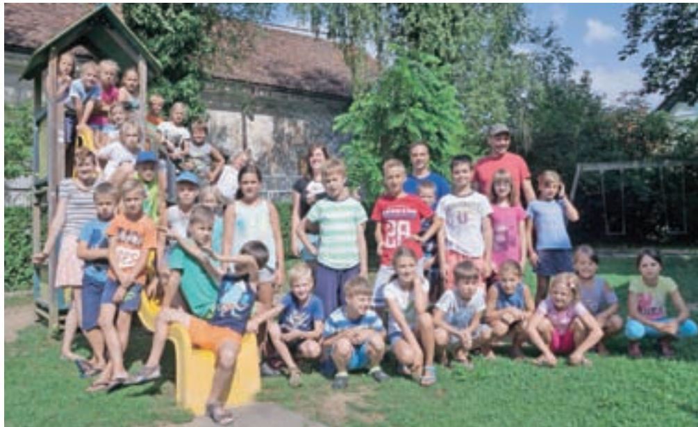
Poletnih aktivnosti za mlade v Kamniku letos ne manjka.

Kamnik – Počitnice so po naporem šolskem letu ne le dobrodošle, temveč tudi nujno potrebne. A pred začetkom počitnic so starši, ki pri varstvu svojih šoloobveznih otrok ne morejo računati na pomoč starih staršev, lahko v precejšnji zadregi, kako v dveh mesecih povežati svoj dopust in finančne zmožnosti z morebitno počitniško ponudbo, ki v današnjih časih ni več tako poceni. V kamniški občini je tudi letos dobro poskrbljeno za različne organizirane aktivne počitnice.