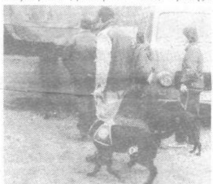
Posebno izurjeni psi so v veliko pomoč pri iskanju ponesrečencev

Natanko ob 11.30 min so v OŠ Bičevje sprožili alarm in začela se je načrtna evakuacija učencev na odrejeni prostor (športni park Svoboda). V poslopju