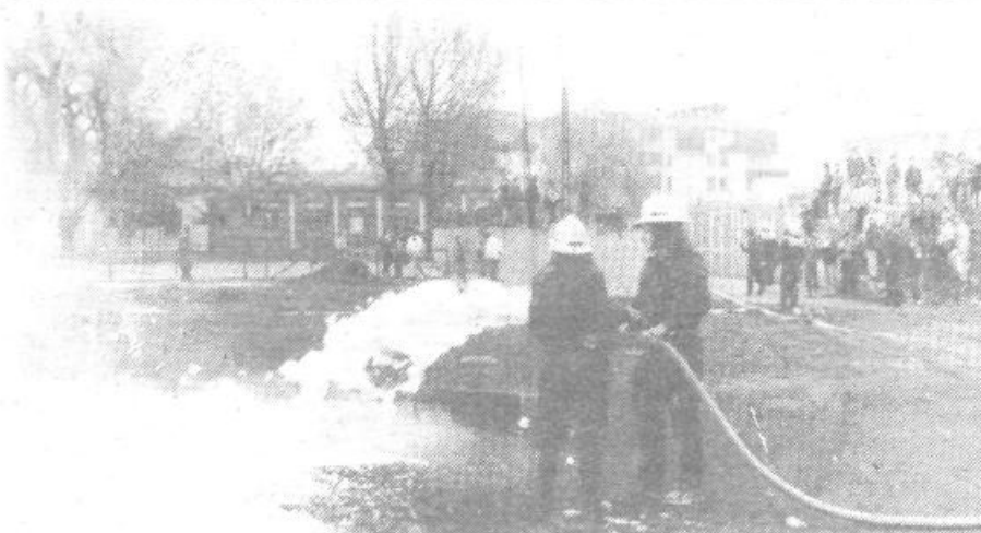
Gasilci so prikazali tudi vajo gašenja s peno

Priljubljeni bodimo, kot da bo jutri vojna in delajmo kot da je 100 let ne bo