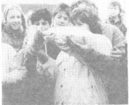
Golob-kurir bo prenesel sporočilo o nesreči

je ostalo le deset markantov z različnimi poškodbami. Razume se, da vsi izvajalci vaje dobro vedo, kaj jim je storiti. Na to so se že precej temeljito pripravili (Center za socialno delo, na primer, je pripravil vse tekoče za delo in evidenco pomoči ponesrečencev in oseb brez stitne ter premoženja, Občinski odbor RK je pripravil inštruktažo dajanja krvi in tako naprej). Specialna enota PMP Tobačne tovarne Ljubljana začne iskati ponesrečence in jim na licu mesta uredi pomoč, nato pa jih prenese v šotor PMP, kjer jim nudijo vso strokovno zdravniško pomoč in poskrbijo za nadaljnje ukrepe. Golobarji (člani golobarskega