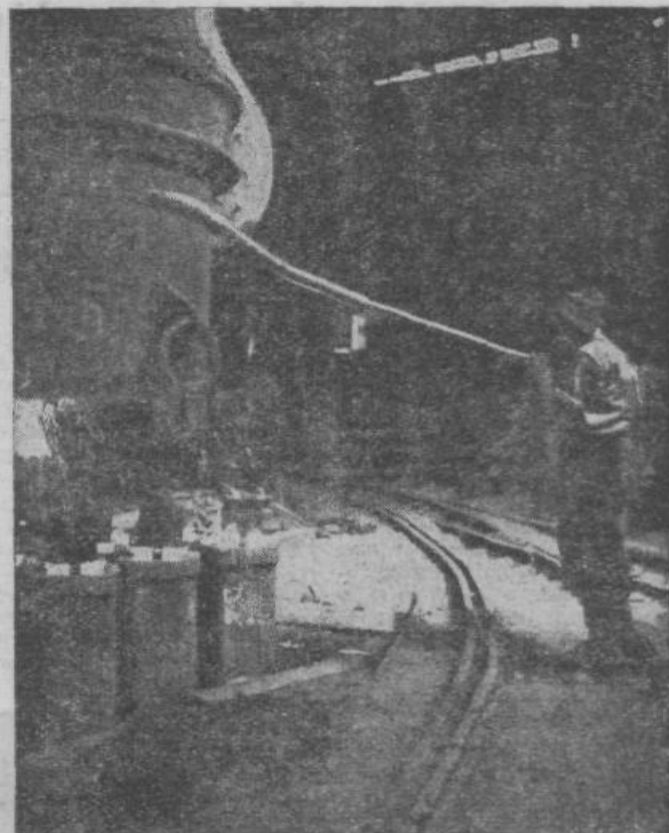
Delo v železarni

Razumljivo je, da je še več drugih činiteljev. Večja produktivnost v ZDA je med drugim tudi posledica hitrejšega uvažanja raznih tehničnih novosti, kar terja od ameriških podjetij konkurenca. Velika denarna sredstva, dober strokovni kader, delovna organizacija po modernih načelih, velika izbira, vse to je Američanom omogočilo dvig proizvodnosti na zavidljivo višino.