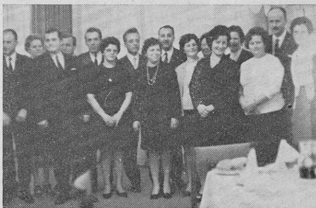
Dolgoletni nagrajeni sodelavci