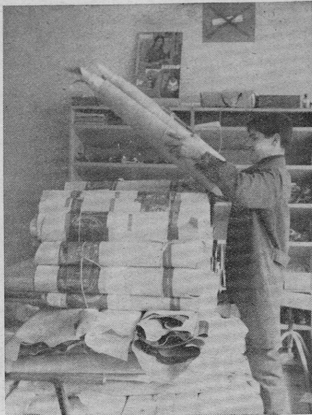
Nakladalec usnjenih »partij«