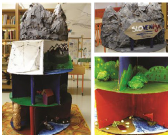
Slika 6: Babilonski stolp

Naslednja skupina (8. a) si je zamislila kip, ki so ga želeli postaviti med police v knjižnici. Po prvotni ideji bi moral biti stolp sestavljen iz narečnih besed oz. jezikovnih zvrsti, značilnih za Slovenijo.