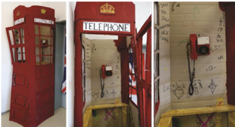
Slika 7: Telefonska govornica

Zadnja skupina (8. b) si je zadala nalogo, da izdela prostor, od koder bi lahko telefonirali, saj telefoniranje v šolskih prostorih ni dovoljeno, oni pa to radi počnejo in v šoli pogrešajo. Nastala je telefonska govornica, rdeča, v angleškem stilu za angleško učilnico (slika 7).