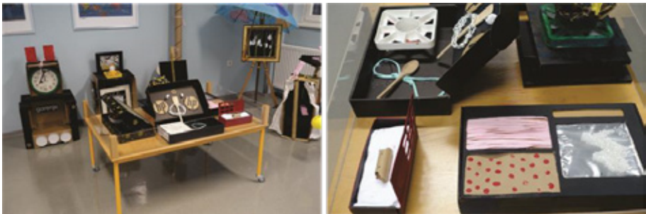
Slika 3: Pogled na del razstave, arheološka zbirka