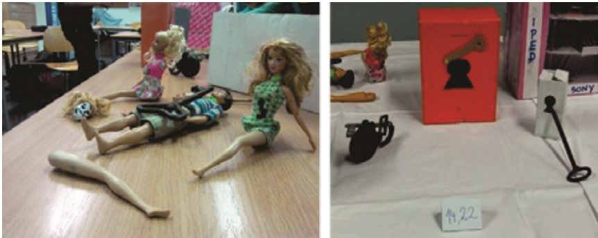
Slika 10: Lomilec ženskih src, Svoboda

Na sliki 10 vidimo, kako sta učenki želeli izdelati instalacijo, ki bi predstavljala nasprotje azila, svobodo. Zapisali sta, da sta s ključi in ključavnicami, ki sta jih vključili v likovno delo, želeli povedati, prikazati, da je svoboda neprecenljiva in se je ne sme zakleniti. Analiza izdelka odkriva zanimiv preplet uporabe vsakdanjih predmetov (lutke Barbi) in izdelanih elementov (ključavnice). Delo je enostavno (tri lutke in tri izdelane ključavnice), jasno berljivo, obenem pa s svojo postavitvijo pušča svobodne interpretacije. Tudi znotraj praks ready-made umetnosti predstavlja ta izdelek učenk solski primer dobrega likovnega izdelka.