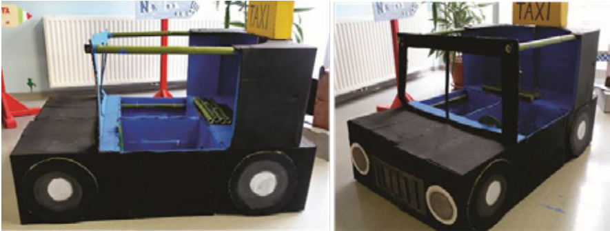
Slika 5: Angleški taksi

pred učilnico ter glede na količino zbranega materiala naredili hodnik skoraj nepreahoden. To je bil prvi, spontan in nenačrtovan poseg v prostor. V nadaljevanju so si učenci zastavljene probleme izbrali sami glede na idejo, kako izvesti likovno nalogo, delno pa tudi glede na prisotnost prijateljev v skupini. Nastali so štirje skupinski izdelki. Prva skupina (8. a) je iz odpadne embalaže izdelala vozilo – angleški taksi (slika 5).