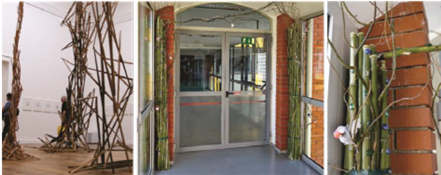
Slika 4: Tracey Emin, Borrowed Light (52. Beneški bienale 2007) in izdelek učencev Portal

Ponovno so učenci zapisali prvo mnenje o predstavljenih likovnih delih. Predstavljamo nekaj značilnih.