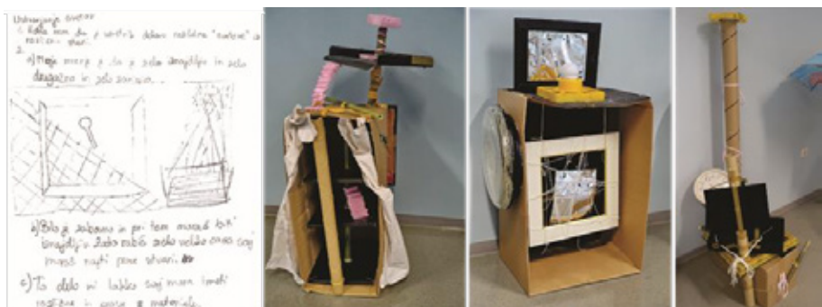
Slika 2: Skica in zapisi, Svet stopnic, Časovni stroj, Neuspelo potovanje časovnega stroja

Po uvodni predstavitvi so med predmeti, ki so jih imeli na razpolago, učenci izbrali tiste, za katere so menili, da bodo z njimi lahko oblikovali svojo idejo. Izbrane predmete so preoblikovali: prebarvali, zvezali, trgali, rezali, lepili, sestavljali, razstavljali in spet na novo sestavljali v nove kompozicijske oblike. Likovno so ponazorili določeno idejo tako, da so pri delu uporabljali predstavljene strategije likovnega izražanja. Svoj likovni poseg so slikovno in besedno utemeljili ter predstavili sošolcem.