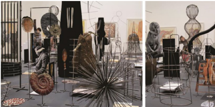
Slika 8: Eva Kotatkova, Asylum (55. Beneški bienale 2013)

Dejavnost smo izvedli v 9. a in 9. b. Likovna tema je izhajala iz skupinske instalacije in principov ready-made. Učenci so skozi proces likovnega ustvarjanja spoznali dandanes eno od prevladujočih zvrsti kiparstva (Lynton, 1986). Seznanili so se z instalacijo kot kiparsko zvrstjo ter si ogledali posnetke instalacij umetnikov, ki so razstavljali na 55. mednarodni likovni razstavi Beneški bienale 2013. Izbrali smo dela Eve Kotatkove (slika 8), Aja Weiweia in Wifreda Díaz Valdéza.