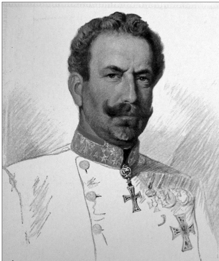
Slika 1: Nadvojvoda Evgen von Österreich-Teschen

je njegova mati Elizabeta Avstrijska izhajala iz madžarske veje Habsburžanov (po pričevanju nadvojvode Evgena naj bi bila njegova mati najprej predvidena za ženo cesarja Franca Jožefa, preden se je ta nesmrtno zaljubil v njegovo Sisi). Njen oče je bil Jožef Anton Habsburški, ki je od leta 1796 zasedal mesto madžarskega palatina. Tako se je v nadvojvodi Evgenu mešala vojaška in politična sposobnost prednikov, ki jo je znal v času svojega življenja zelo dobro izkoristiti. Evgen je imel 6 bratov in sester (od tega sta dva umrla kot dojenčka) in eno polsestro (njegova mati je bila namreč v prvem zakonu poročena s Ferdinandom Karlom Avstrijskim Este, ki pa je umrl leta 1849). Najbolj znana sestra nadvojvode Evgena je bila Marija Kristina, ki se je 29. novembra leta 1879 poročila s španskim kraljem Alfonsom XII. Tako se še danes v španski kraljevi družini pretaka kri družine nadvojvode Evgena. 2