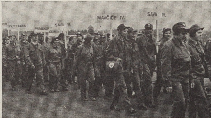
Enote civilne zaščite pred tekmovanjem