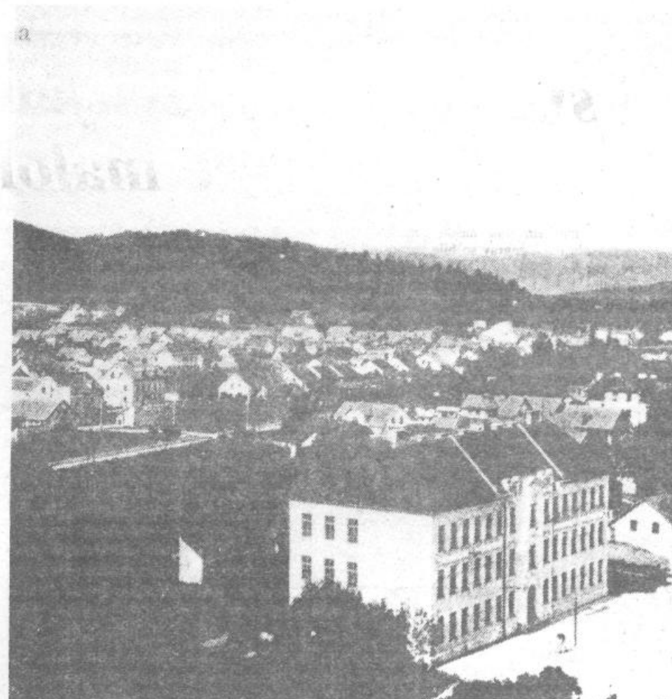
Osnovna šola Vič z bližnjo okolico v letu 1922

Sprva velja poseči celo v prejšnje stoletje, ko so naprednejši Vičani pošiljali svoje otroke v ljubljanske šole. Da bi zgradili svojo, so začeli razmišljati okrog leta 1870. Dobili so jo leta 1896, ko je ljubljanska občina onemogočila šolanje viških otrok v mestnih šolah. Sprva se je pouk odvijal v zasebnih hišah, 1898 so zgradili prvo šolo ob Tržaški cesti, ki pa je bila kmalu premajhna. Veliko, novo prostorno šolo so zgradili leta 1911 in ta šola še danes služi svojemu namenu. Poznamo jo vsi, saj stoji ob »gimnazijski« stavbi na Tržaški cesti. Že ob otvoritvi je bila šestrazrednica in pouk v njej je obiskovalo 600 otrok, dve leti kasneje pa se je številka povzpela na 844. Kot zanimivost velja omeniti, da je bil tedanji šolski upravitelj oproščen pouka, kar je bil prvi primer na Kranjskem. Med prvo svetovno vojno je bil pouk spričo zasedbe vojske močno skrčen in oviran. Šola se je razširila v osemrazrednico leta 1919, ko je bil uveden tudi obvezen pouk telovadbe za deklice. Pričela se je tudi obrtna nadaljevalna šola ter pomožni oddelek za slabše nadar-