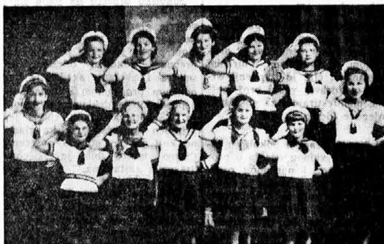
Zenski narastaj Sok. društva Cakovec, slavi kraljev rodendan

Sokolska četa Novo Selo, srez Trstenik, otvorila je na svečan način knjižnicu i čitaonicu na Rodendan N. J. V. Kralja. Otvaranje je bilo povezano sa osnivanjem Poljoprivrednog oteka, čime je ova agilna četa upotpunila svoj rad na podizanju sela.