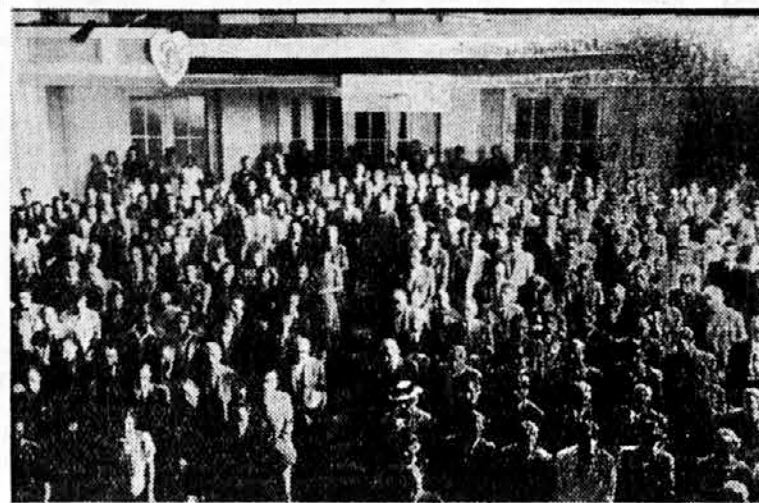
Sa proslave Kraljevog Rodendana na Sušaku

Tri istaknuta prestonička fudbalera napraviše na jednoj »derbi« - utakmici ispade, koji ih bacise u zasenak — potukoše se na najgori način.