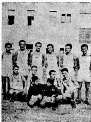
Štafeta Sokolskog društva Glina