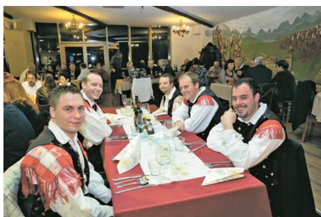
Z mnogimi prestižnimi priznanji nagrajeni Akordi so poskrbeli za odlično glasbeno vzdušje na letošnjem novoletnem plesu postojnskih obrtnikov in podjetnikov