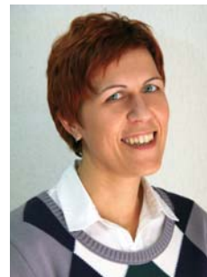
Pripravljala Irena Dolgan