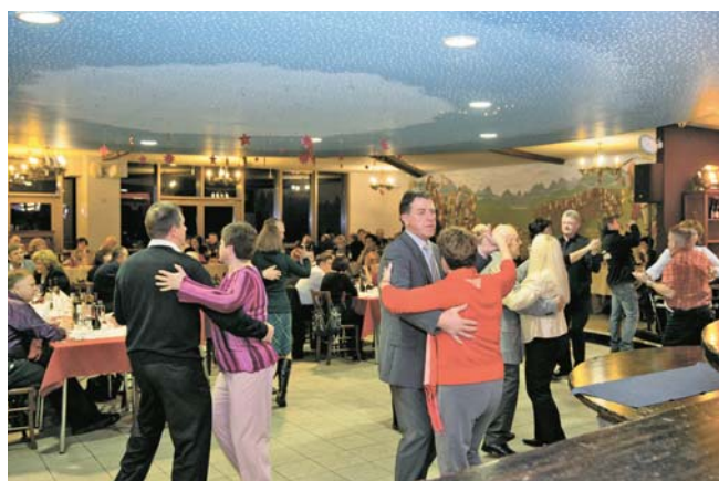
Ob zvokih Akordov so se plesalci veselo zavrteli po plesišču