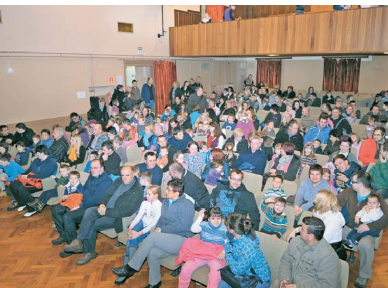
Otroci s starši v pričakovanju čarodeja in dobrotnikov v Logatcu

Priloga k poročilu OOO Logatec z obiska treh dobrih mož, objavljenemu na str. 7