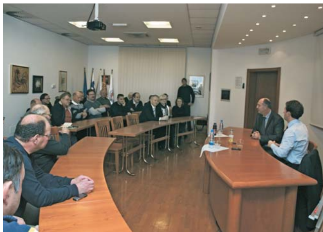
Med obiskom predsednika DZ Gregorja Viranta na logaški zbornici

Predsednik DZ se je po pozdravu zahvalil za sprejem. Ob omembi (ne)obveznega članstva je poudaril, da je bilo sodelovanje zbornice z Vlado v mandatu 2004 do 2008 zgledno in za obe strani koristno; to je bil čas mandata Klun – Pšeničny. Zatem je poudaril, da kot liberalec podpira prostovoljno članstvo. Nadaljeval je z opisom splošnega položaja in stanja v državi. Poudaril je, da se vlada in koalicija trudita, da bi zagotovila kredibilnost države nasproti tujini. Če ne bi bilo rezov v javni sektor, bi javni dolg države le še naraščal. Pozitivno je, da je bil sprejet proračun za prihodnji dve leti. Sprejeta je bila pokojninska reforma. Predvidene so nadaljnje spremembe v prid izboljšanja poslovnega okolja; mednje sodijo »davčne počitnice« za začetnike. Izjemnega pomena je sanacija bank. Država se je odločila za enega od modelov – za ustanovitev t.im. slabe banke, resno razmišlja tudi