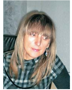
Pripravljala Silva Šivec