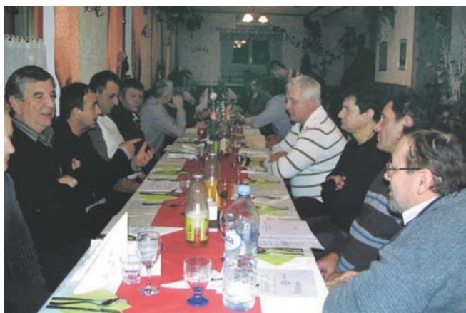
Med sejo skupščine OOOZ Vrhnika

Sestala se je tudi skupščina OOOZ Vrhnika, in sicer 19. decembra. Člani so obravnavali program dela in finančni plan zbornice za naslednje leto. Ker se še ne ve, kako bo z obrtnim zakonom,