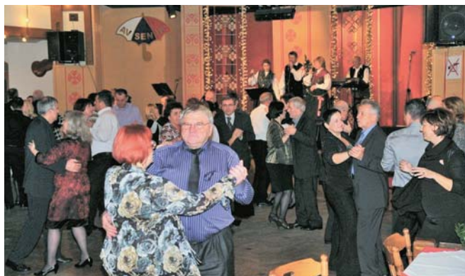
Ob zvokih hišnega ansambla Avsenik so udeleženci z veseljem zapolnili plesišče.