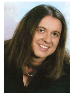
Pripravljala Barbara Grum Vogrin