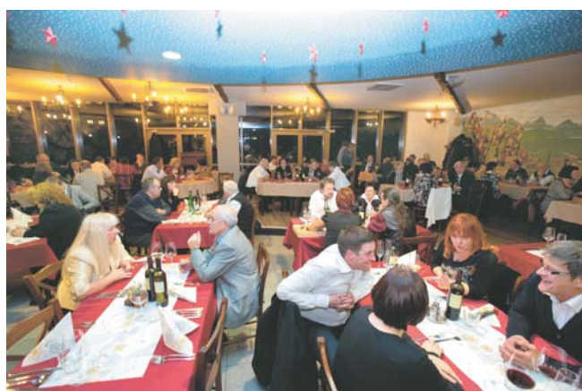
Prijetno pomenkovanje na letošnjem prednovoletnem srečanju