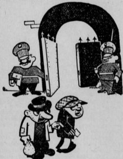
Ko sta zapustila jetnišnico »Kaj misliš, ali je tu navada, dajati uslužbenecem napitnino?«