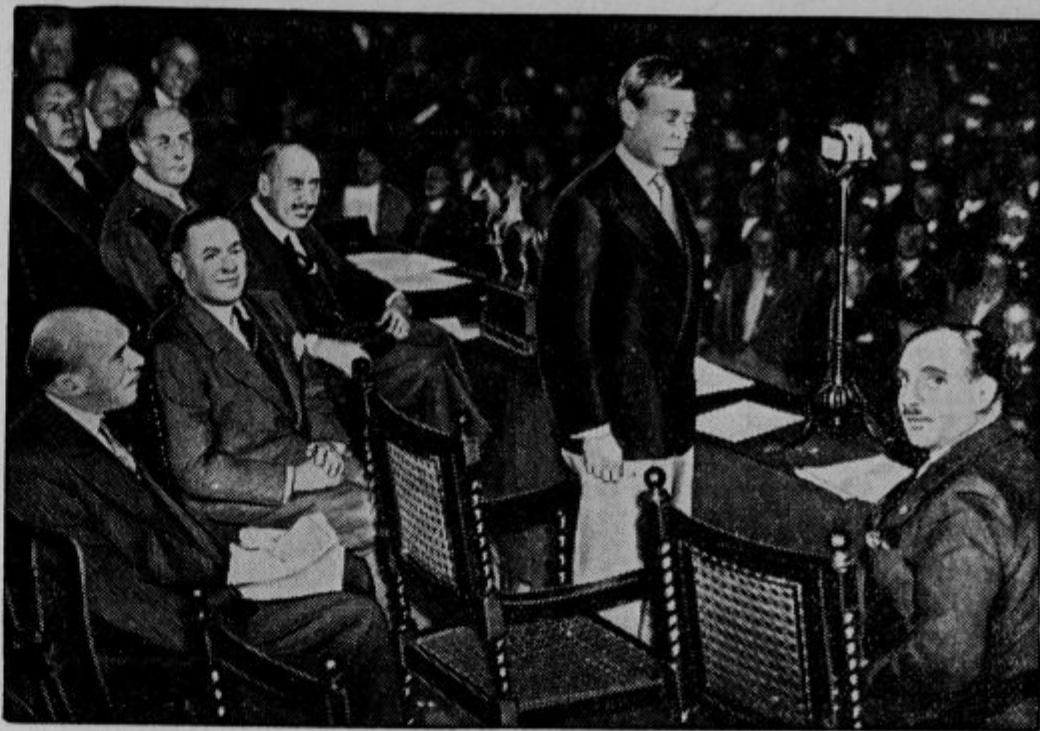
Angleški prestolonaslednik princ Waleski je te dni govoril na zborovanju angleških frontnih bojevnikov. Njihova zveza se imenuje »British Legion«. Med drugim je tudi poudarjal, da bi ravno frontni bojevniki morali skrbeti, da bi se ohranil mir. Zato je pozivljval angleške bojevnike, naj se sporazumejo z nemškimi in stopijo z njimi v stik.

Preden smo se dvignili, sem moral nehati pisati, ker so moji prsti, ko sem slonel ob mrzlem jeklu pri oknu, od mraza čisto odreveneli. Ko sem z blazine stopil na tla, se mi je zdelo, da imam led pod nogami. Prav nič pa nismo občutili strašnega pritiska vodnih plasti, ki so težile našo kroglo. Na naša okna je pritiskala teža 19 ton. Naša krogla pa je morala vzdržati pritisk 7016 ton, kateri se je polagoma manjšal, čim bolj smo se dvigali proti površju.